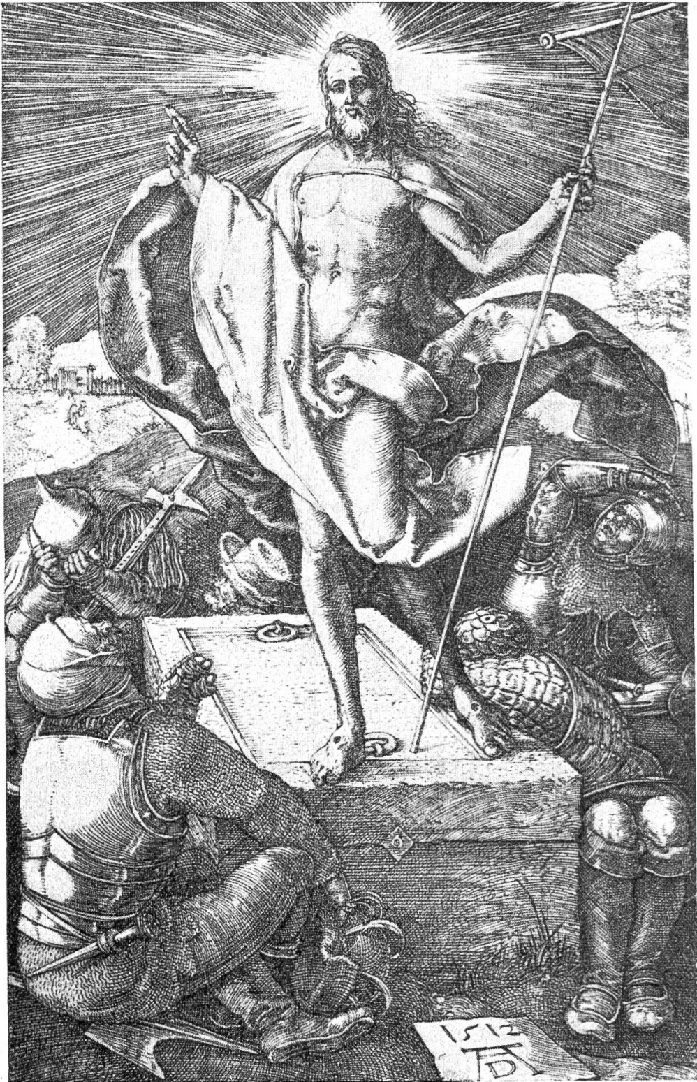
Auferstehung von Dürer