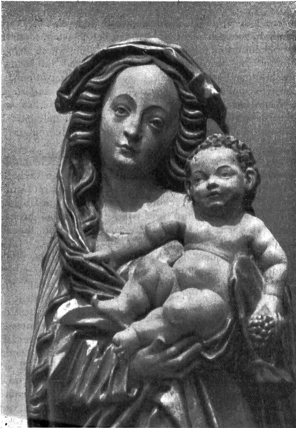
Marien-Statue der Pfarrkirche Büsserach (Sol.)

Wir wollen ab und zu auch in den Glocken vom Stein etwas die nähere Heimat betrachten und schauen, was aus früheren Jahrhunderten in unserer Gegend an Interessantem noch vorhanden ist. Zu den schönsten spätgotischen Madonnen gehört das in Holz geschnitzte Marienbild der Pfarrkirche Büsserach. (Hier Brustbild). Der Künstler ist unbekannt. Die Statue verrät elsässischen Einfluß und dürfte um das Jahr 1520 entstanden sein. Sie stammt wohl aus einem früheren Marienaltar von Büsserach. Die Statue ist nicht in strengen romanischen oder frühgotischen Formen gehalten, mit der beinahe offiziellen Weltkugel mit Kreuz,