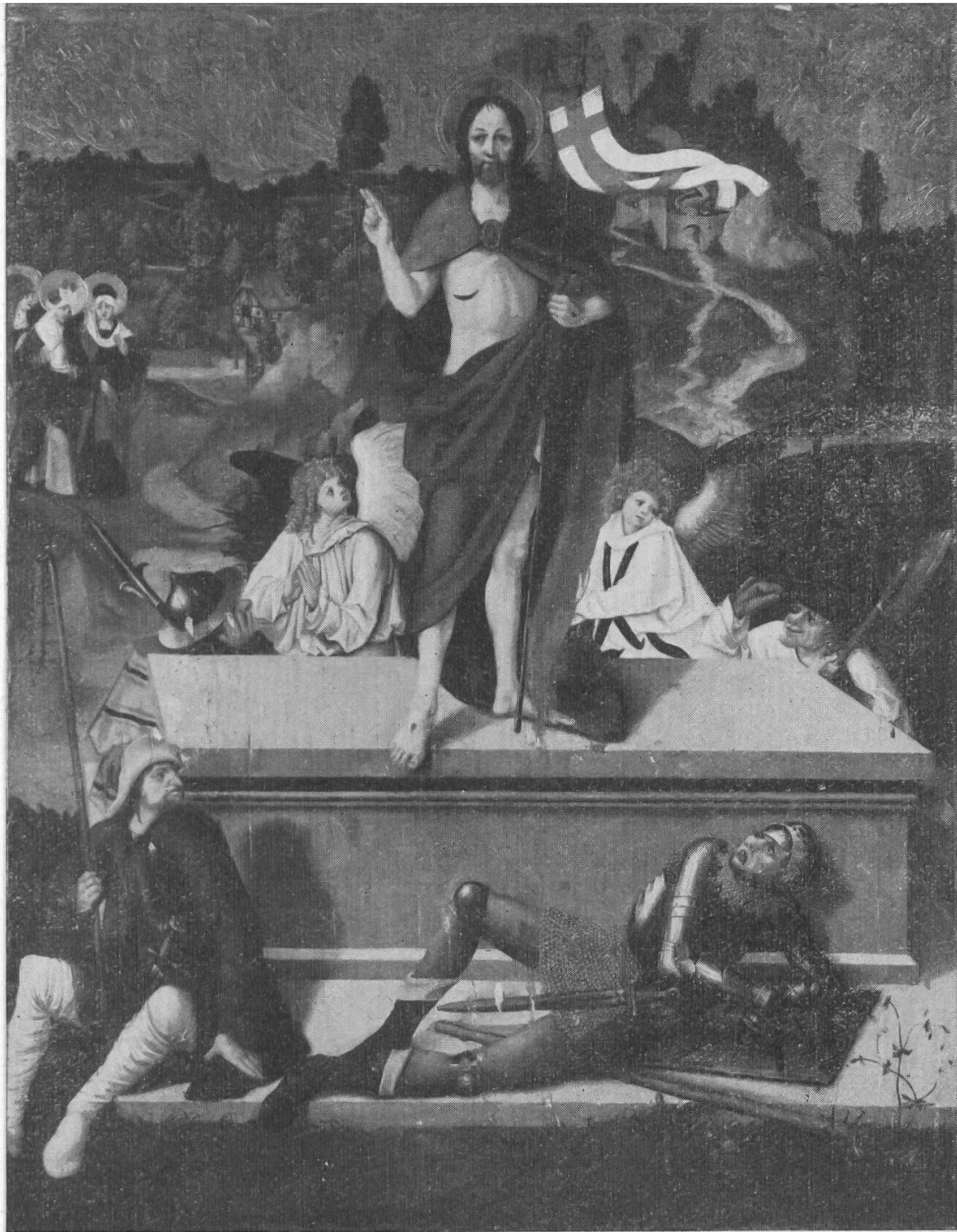
Auferstehung Christi von einem Schweizermeister um 1510 aus der öffentlichen Kunstsammlung von Basel

ruft der Mann sie beim Namen: „Maria!“ und ein Schrei der Freude und des Glückes zwingt sie auf die Knie. Beim Klang der Stimme erkennt sie Jesus und ruft aus: „Rabboni“, d. h. Meister. Sie will ihn umarmen; doch er wehrt ihr und sagt: „Rühre mich nicht an, aber gehe hin und verkünde den Brüdern, dass ich auferstanden.“ (Mk. 16, 9.)