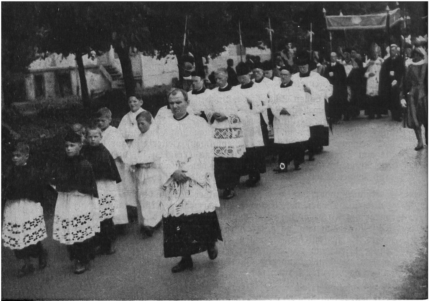
Ein Prozessionsbild vom Trostfest 1946.