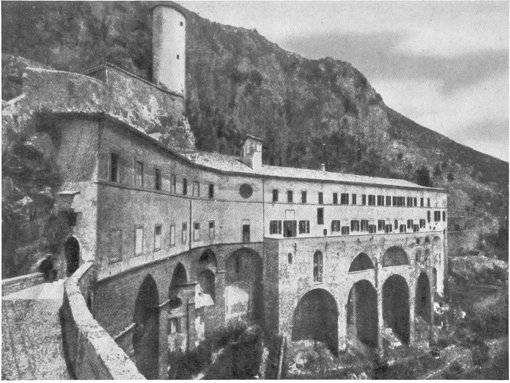
Das Höhenkloster Sacro Speco von Subiaco.