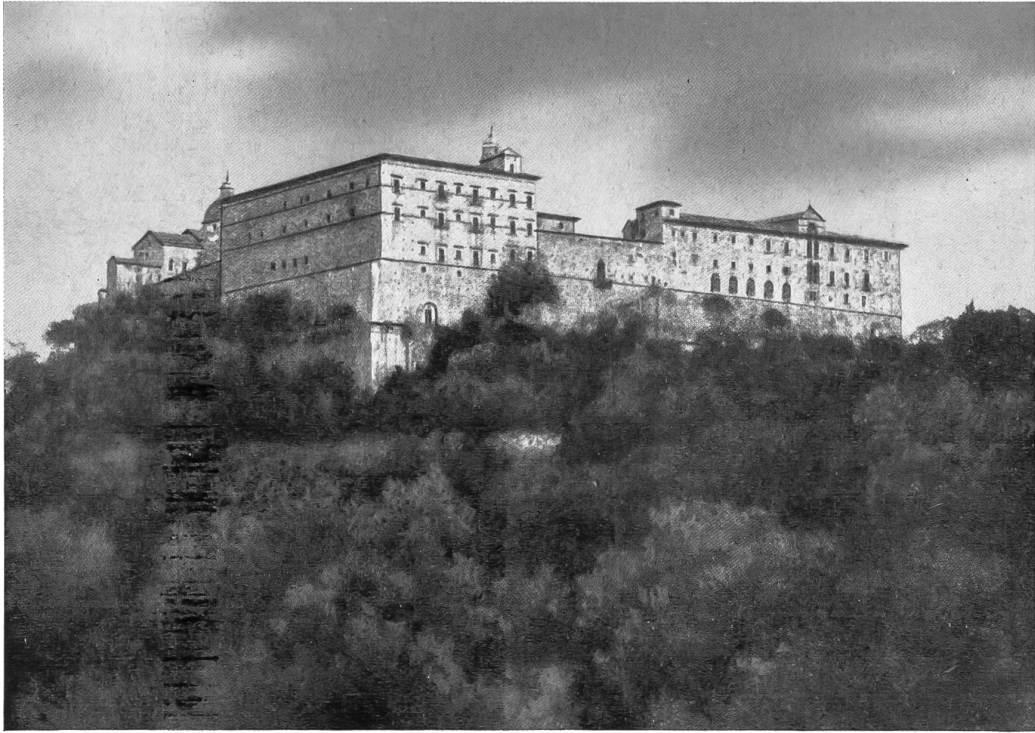
Monte Cassino, Stammkloster der Benediktiner.