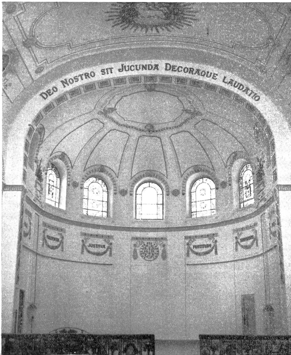
Ein Blick in die Kuppel der Kirche des St. Gallusstiftes.

schlosserei Mäser in Dornbirn. Dieses stilgerecht klassizistisch ornamentierte, schmiedeeiserne Geländer zieht sich, von marmorenen Mittelgliedern gestützt, von der rückwärtigen Nischenkapelle beginnend, am Marienaltar, Hochaltar und Herz-Jesu-Altar vorüber bis hinunter zum Eingangsportal, schließt somit die beiden Querschiffe samt dem Presbyterium ab. Eine reiche symbolische Ornamentik rankt sich um das Gitter-Stubwerk; Guirlanden und Fruchtsträuße verbinden die gleich diesen in getriebenem Kupfer ausgeführten Zierschildchen mit den Darstellungen der Friedens-