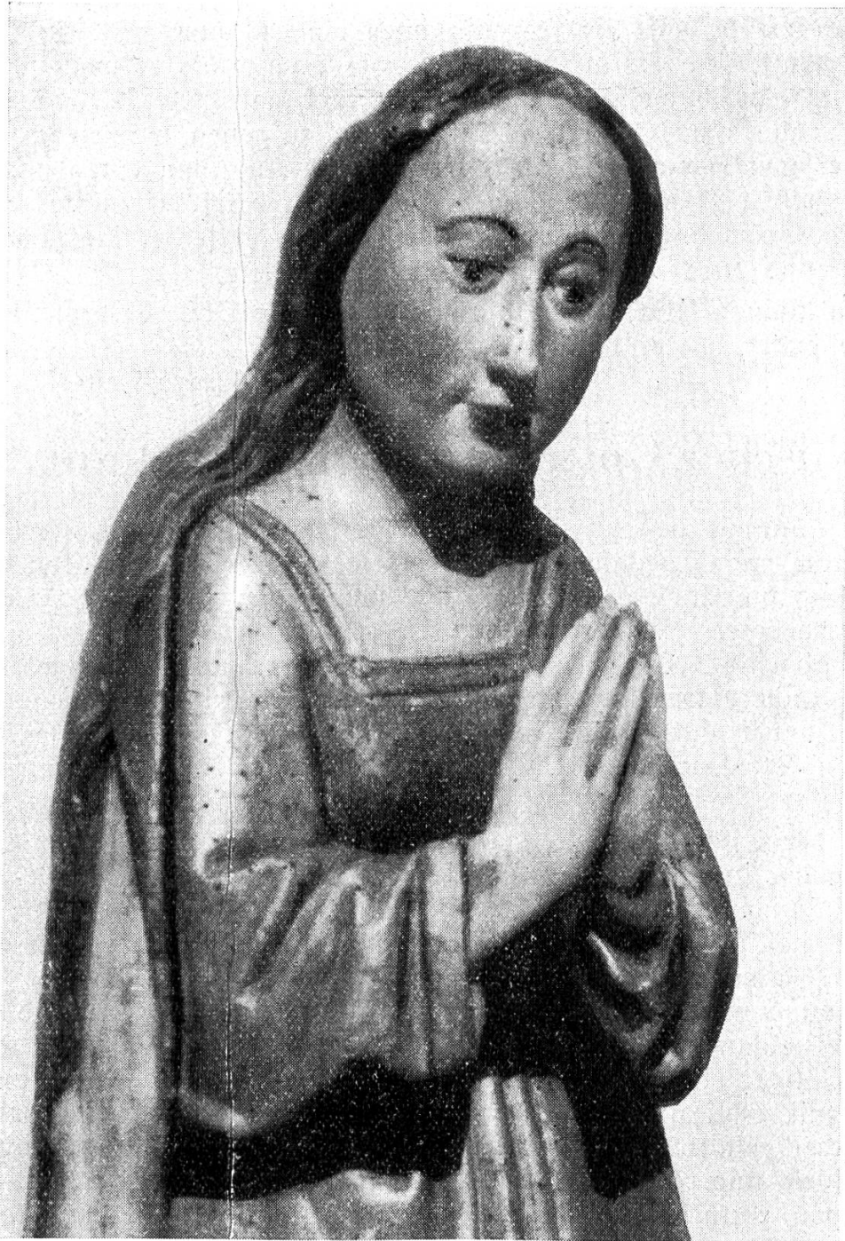
Madonna in Delsberg — Privatbesitz.

es, daß ihr beide bereit seid, sogar eine große Gefahr auf euch zu nehmen, wenn es gälte mich zu verteidigen? Und doch bin ich eine armselige Kreatur. Ihr seid aber nicht imstande, einen kleinen Spott zu verzeihen, der euch in der Schule getroffen hat. Und doch handelt es sich darum, eure Seelen zu retten, für welche unser Erlöser sein kostbares Blut vergossen hat. Wollt ihr mit eurer Rachsucht euere Seele verlieren?“ Nach diesen Worten hielt er schweigend das Kruzifix in die Höhe. Bei einem solchen Schauspiel des Mutes und der Liebe mußten sich beide für besiegt