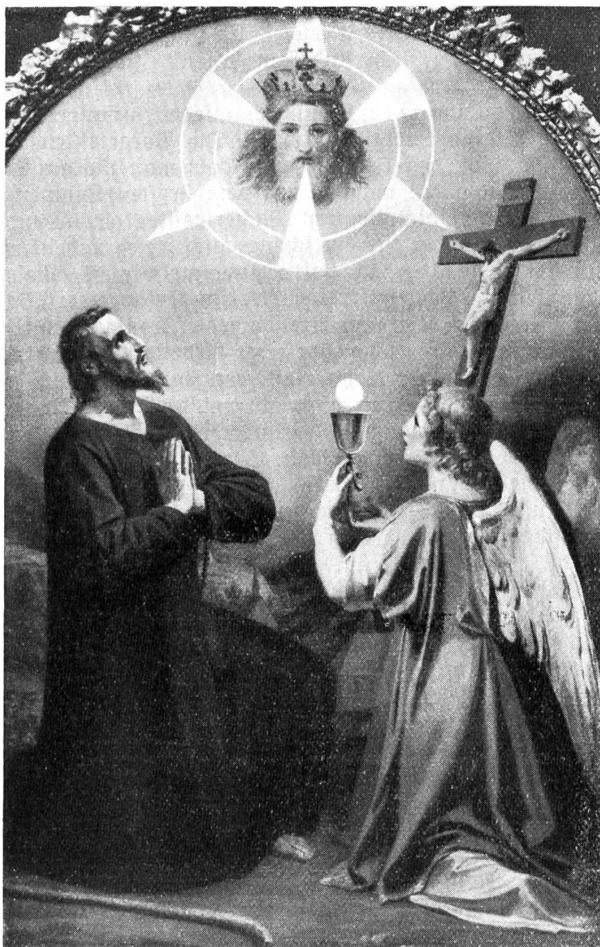
Der hl. Bruder Klaus; Gemälde von Paul Deschwanden.

Bruder Klaus, ein grosser Faster und Büsser, ein grosser Verehrer des Altars- sakramentes und des Leidens Christi, ein grosser Verehrer Mariens und eifriger Beter des Rosenkranzes.