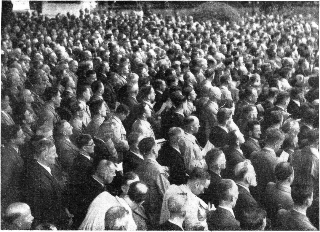
Ein Bild von der betenden Männerwelt bei der Friedenswallfahrt.