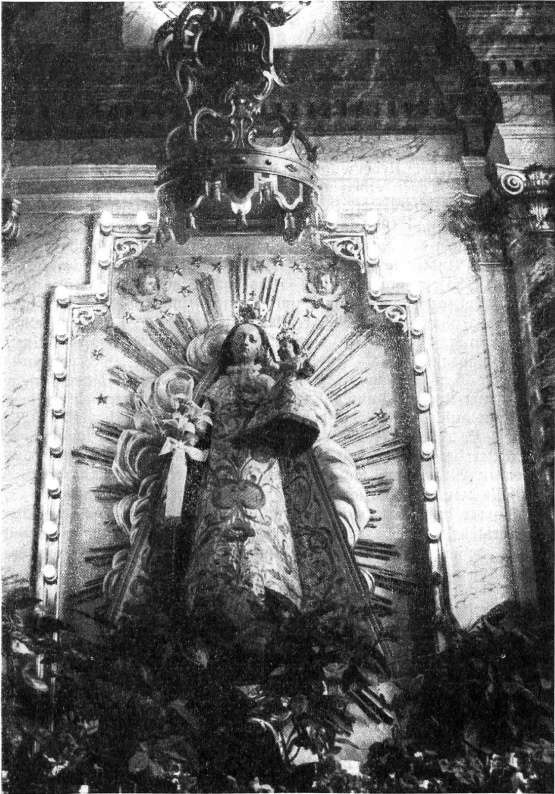
Muttergottes-Statue auf dem Hochaltar zu Wolfwil (Sol.)