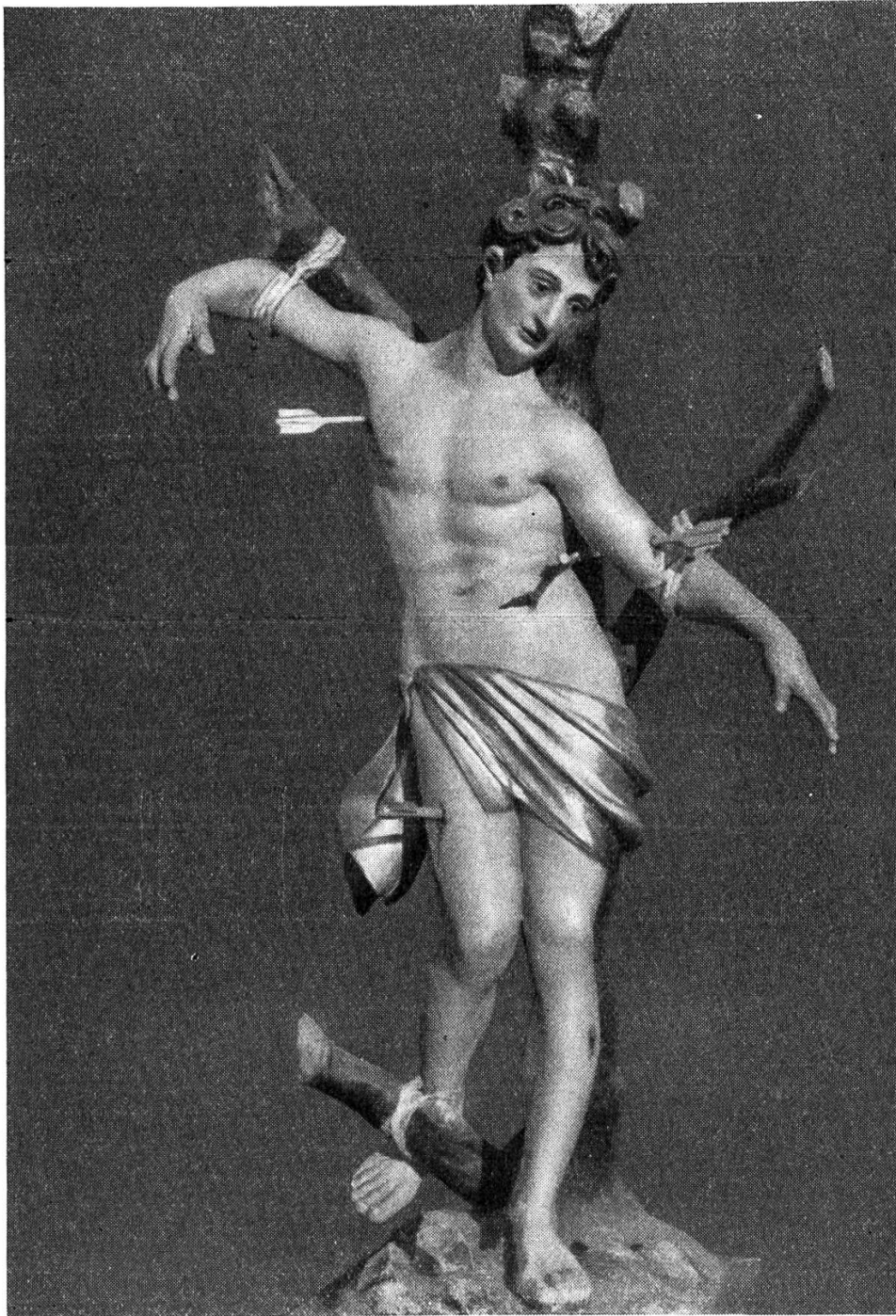
Holzstatue des hl. Sebastian aus der Mitte des 17. Jahrhunderts in Kleinlützel.

in die Katakomben hinab und ermunterte die christlichen Glaubensbekenner zur Treue und Standhaftigkeit. Dasselbst holte er sich auch im heiligen Messopfer und in der Kommunion den Mut und die Kraft zum Bekenntnis und zum Leben nach dem Glauben.