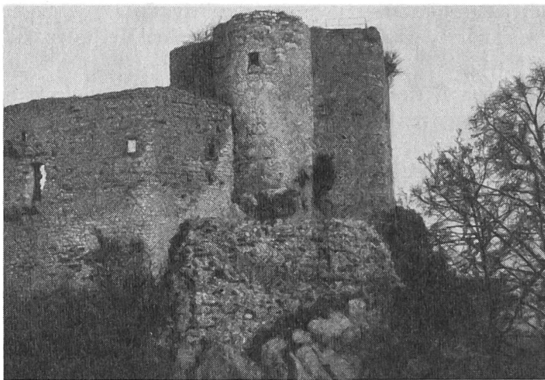
Landskron, Wohnturm und Palas von Westen, 1956

Auf dem Landskronberge standen im Mittelalter drei Burgen. Der westlichste Felssporn trug einst die Feste Rineck . Mit Ausnahme weniger Mauerreste hat sich nichts von der Anlage erhalten. Die Geschichte von Rineck scheint unbedeutend gewesen zu sein. Auf dem östlichsten Punkt des Grates sind noch ansehnliche Reste der Burg Alt-Landskron erhalten. Im Basler Erdbeben von 1356 wurde die Burg zerstört, und in der Folge scheint sie