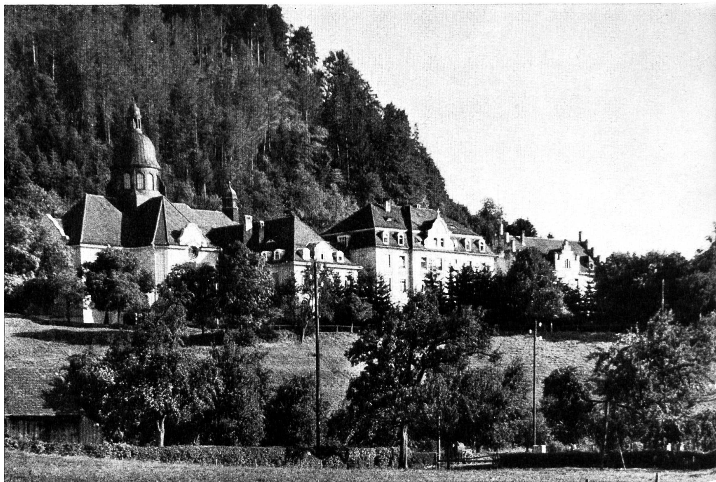
St. Gallusstift Bregenz

bei keine besondern Sorgen; die Hauptsache war ihm, dass sich Altes und Neues, Gotisches und Romantisches, Barock und Empire brüderlich zusammenfügen liess. Wie froh waren die Reliquienschreine, als sie anno 1906 aus ihrer originellen Umgebung befreit und nach kurzem Aufenthalt in der Gangkapelle zu Bregenz, wieder an ihren Geburtsort, nämlich in den aus dem Klemmschen Kunstatelier stammenden Hochaltar in der Klosterkirche zu Bregenz gelangten.