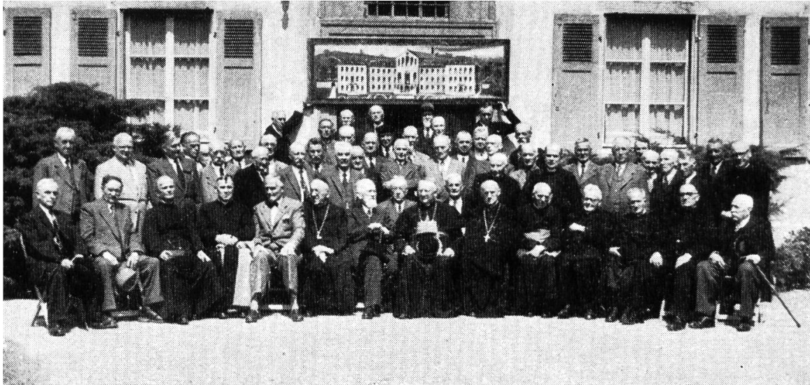
Treffen der Ehemaligen von Delle, in ihrer Mitte S. Eminenz Kardinal Maurice Feltin, Erzbischof von Paris

bis nach München, wo wir im Kloster St. Bonifaz gastliche Aufnahme fanden. Am folgenden Morgen ging es wieder dem Bahnhof zu, denn es galt, so bald wie möglich Salzburg zu erreichen. Der Zug durchquerte die etwas langweilige Münchener Ebene, die unsere Bewunderung nicht so sehr in Anspruch nahm wie das prächtige, bayrische Hochland, und führte uns über die österreichische Grenze, Salzburg zu. Beim Anblick des wunderbaren, von hohen, schneebedeckten Alpenketten umrahmten Landschaftsbildes mussten wir unwillkürlich die Worte des Dichters bestätigen, die Salzburg und seiner Umgebung Pracht in folgenden Versen würdig schildern: