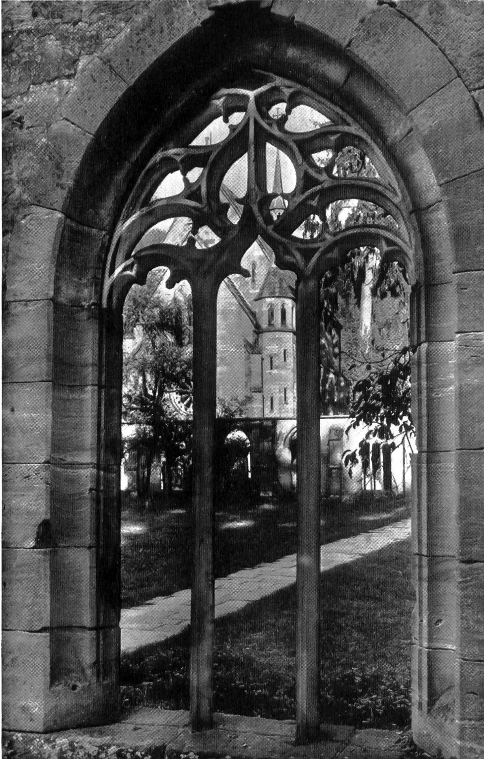
Gotisches Masswerk