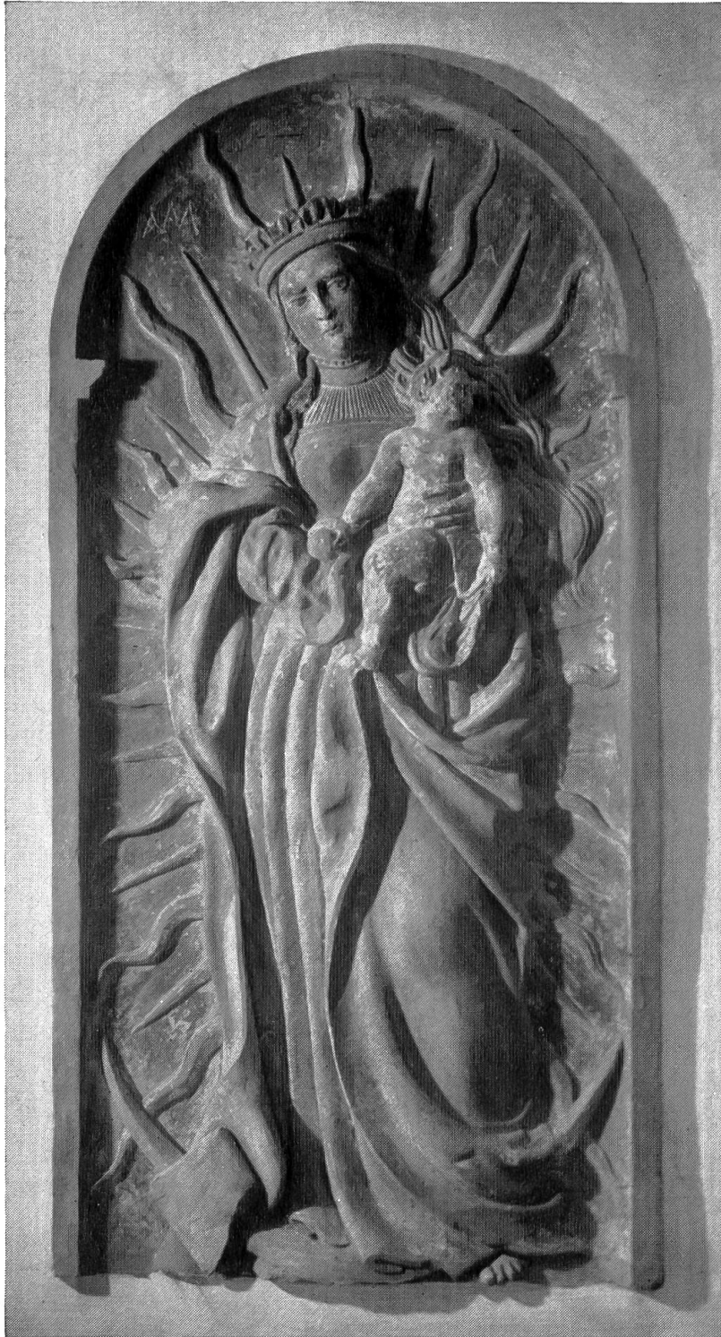
Madonnenrelief im Kloostergang (vgl. Seite 261)