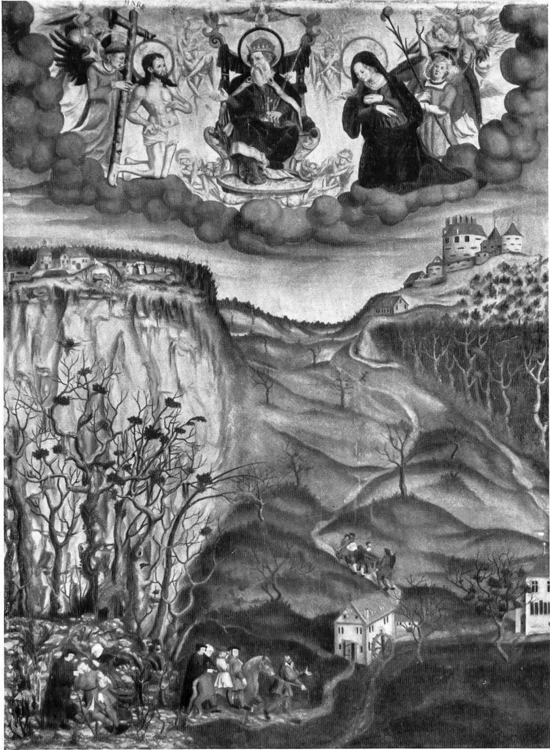
Reichenstein'sches Mirakelbild (1543)