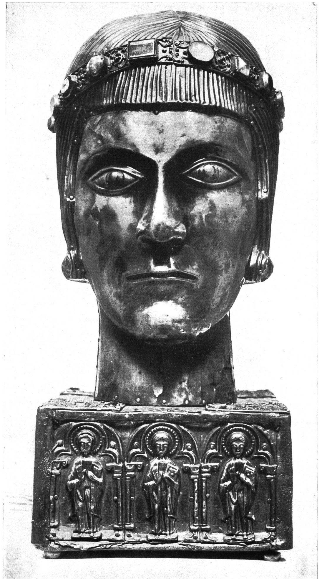
Eustachius- haupt (13. Jahrhundert)