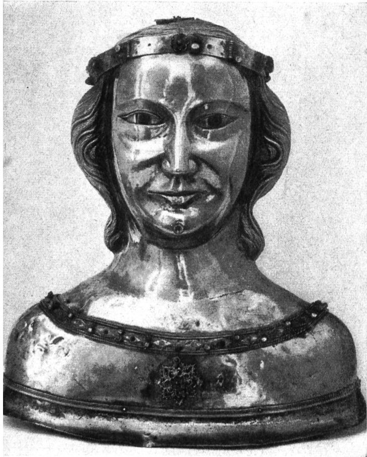
Reliquiar der heiligen Ursula (13. Jahrhundert)

Landschaft gesondert versteigert werden. In der damaligen Notlage der Stadt sah sich die Regierung gezwungen, die Tafel zur Versteigerung Liestal zu überlassen.