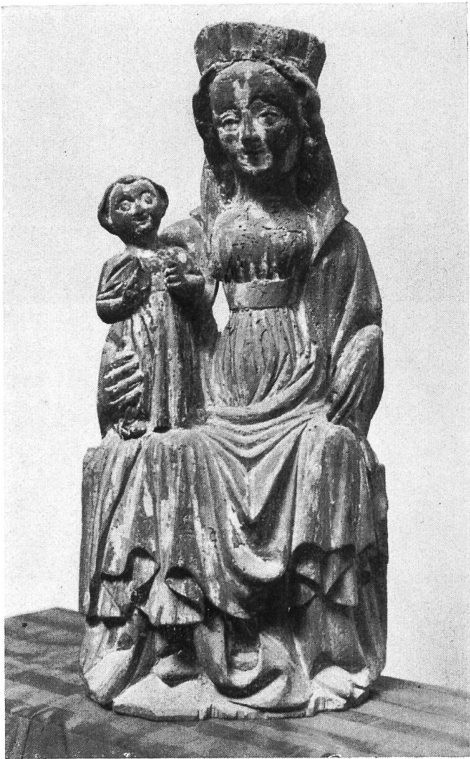
Madonna aus Dornach (1400)

Gottsuchende Menschen gleichen vielfach jenen drei Weisen aus dem Morgenland, die sich aufmachten, um den neugeborenen König zu suchen, von denen der Evangelist berichtet: «Sie fanden das Kind mit Maria , seiner Mutter» (Mt 2, 11). Es ist darum nicht erstaunlich, wenn im christlichen Bildgut Maria einen so grossen Raum einnehmen darf. Schon die Christen früherer Zeiten haben der allerseligsten Jungfrau in ihrer Liturgie und in ihrem Gebetsleben einen besonderen Platz eingeräumt und konnten die Gottesmutter nie von ihrem Sohne trennen. Die Lehre über Maria und die Marienverehrung innerhalb der Kirche ist gewachsen und gleicht jenem Senfkorn, dem winzigen Samen, aus dem ein kleiner Halm spriess, wächst und sich entfaltet, dabei aber doch in seinem Wesen nie aufhört, dieselbe Pflanze zu sein, die er anfangs war. Wer wollte behaupten, die Entwicklung einer Pflanze werde nur durch äussere Einflüsse verursacht? Sie kommt vielmehr aus dem Innern, aus dem kostbaren Saft selbst, der das Leben und damit das Wachstum hervorbringt. Der marianische Kult liegt im Evangelium Jesu Christi selber verborgen, und er musste unter dem Walten des Heiligen Geistes zu seiner Zeit in der Kirche offenbar werden.