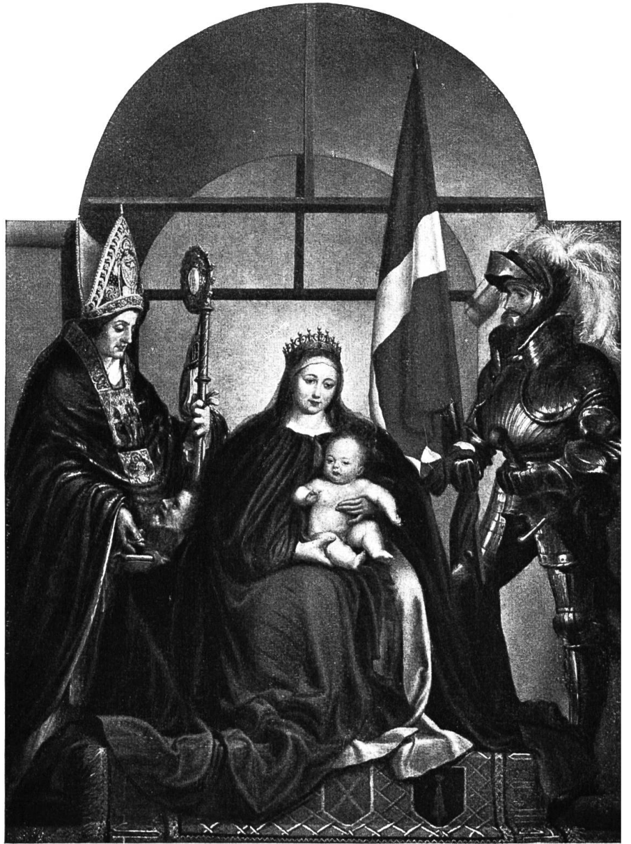
Zetter'sche Madonna von Hans Holbein