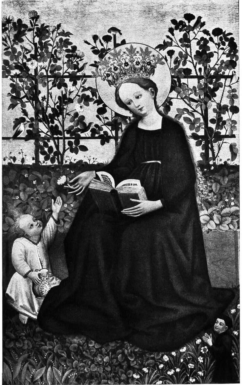
«Madonna in den Erdbeeren» (1420—1430)