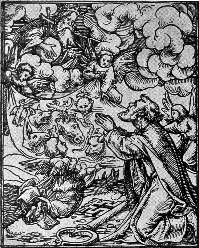
Vision Petri Holzschnitt, Holbein Hans d. J.

allerlei vierfüßigen und kriechenden Tieren und auch Vögeln. Eine Stimme rief ihm zu: Schlachte und iss! Petrus aber sprach: Das sei ferne von mir, noch nie habe ich etwas Unreines gegessen. Da sprach die Stimme: Was Gott für rein erklärt, darfst du nicht unrein nennen! Das geschah dreimal. Dann wurde das Tuch wieder in den Himmel aufgenommen» (Apg 10, 11—16). Während Petrus noch über das Gesehene nachdachte, klopfen unten am Portal die Abgesandten des römischen Hauptmannes Cornelius, die den Petrus ersuchten, mit nach Caesarea zu kommen. So verstand Petrus den Wink Gottes und ging frohen Herzens zu Cornelius, den er mit seinem ganzen Hause taufte. Petrus ist der erste Heidenmissionar!