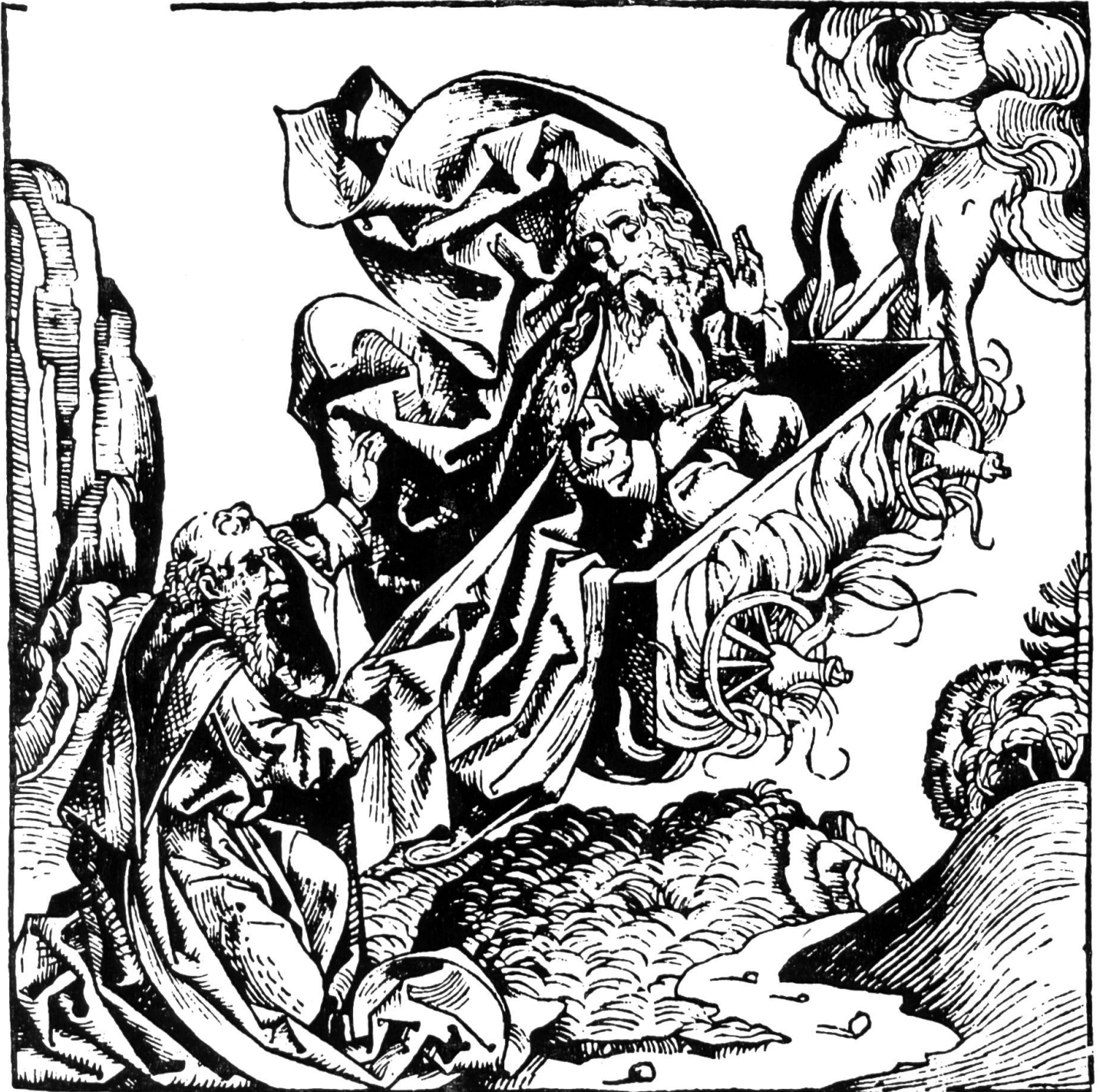
Elias fährt gen Himmel