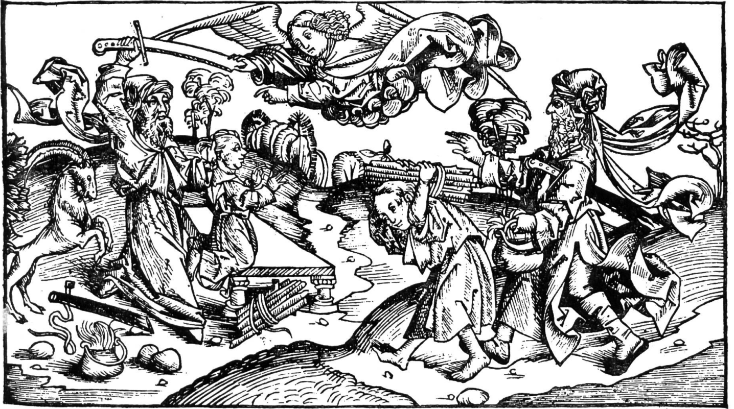
Abraham opfert seinen Sohn Isaak