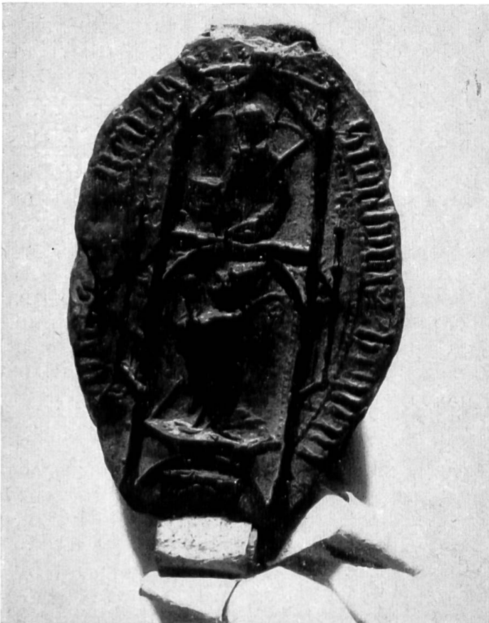
Pontifikalsiegel des Abtes und Weihbischofs Heinrich Rotacker

Vergleich, der die strenge Bestrafung der Schuldigen vorsah, verhindert werden.