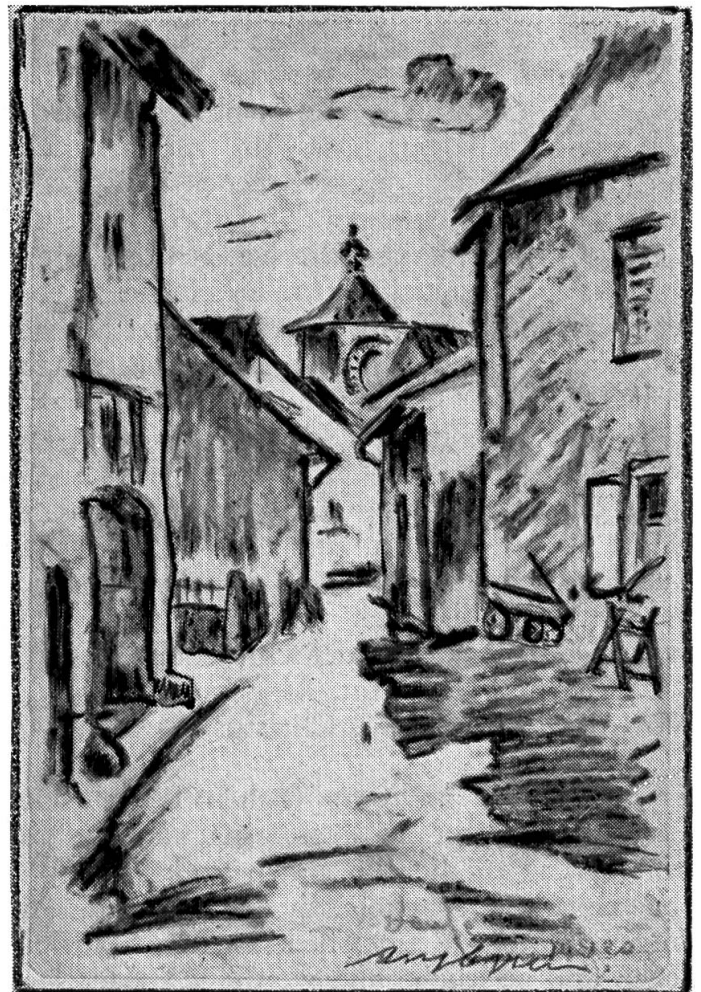
Laufen, Hintere Gasse und Obertor von A. Cueni

Das Birstal ein Hausgang. Auf beiden Seiten offen. Oft zieht ein harscher Wind durchs Tal.