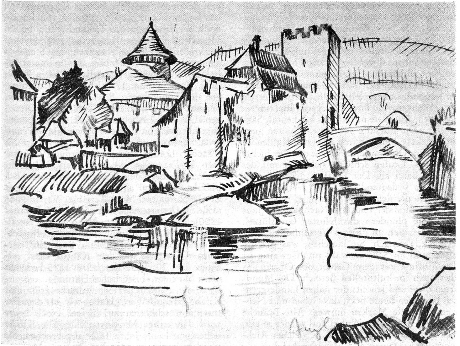
Zwingen, Schloss und Ramsteinturm von A. Cueni