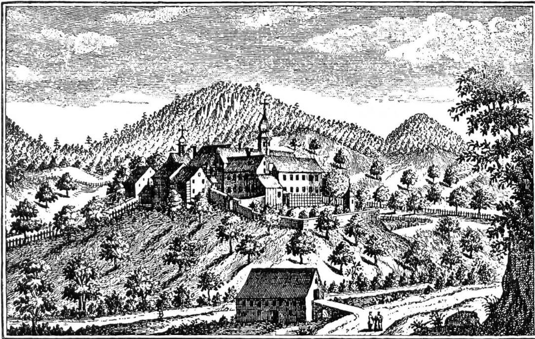
ABTEY BEINWEIL. In dem Canton Solothurn von Abend anzusehen. A. St. Johannes. B. Ljfel Fluss. Em. Büchel del. 1757.