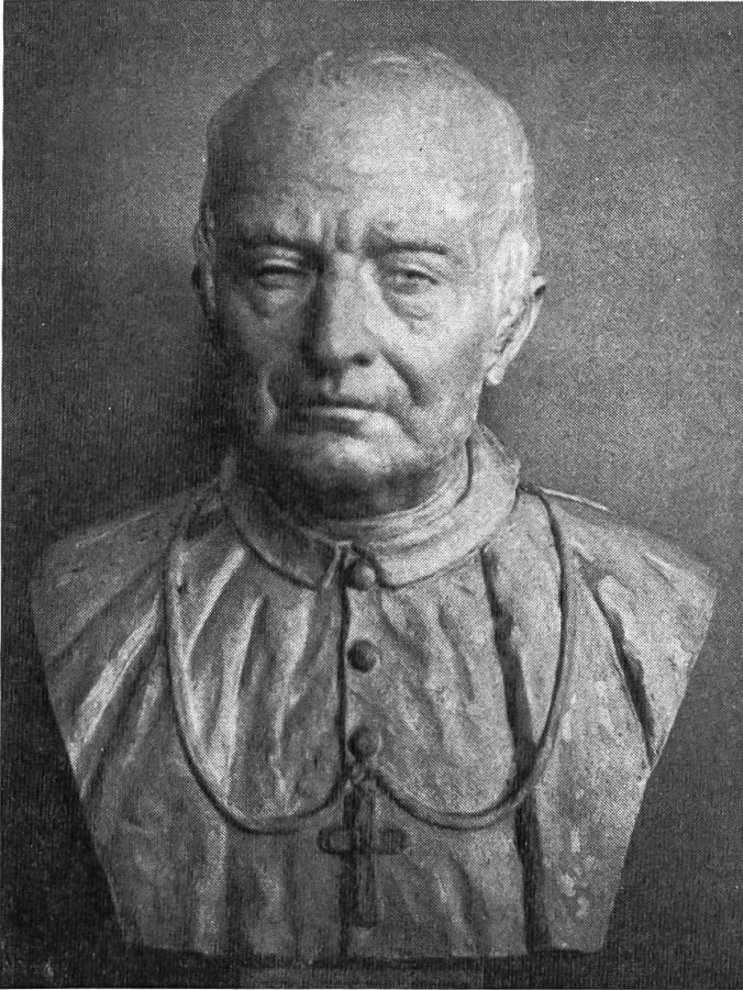
Abt Karl II. Motschi Büste im Refektorium des Klosters

mit dem regierenden Landammann Wilhelm Vigier. Castex meldete nun dem Abt, dass Solothurn diesem Projekt günstig gesinnt sei und man müsse rasch handeln, denn in kurzer Zeit würden sich die Verhältnisse gründlich ändern. Schliesslich verhandelte Abt Karl mit der Regierung, und mit deren Wissen und Einverständnis wurde ein Kauf- und Tauschvertrag