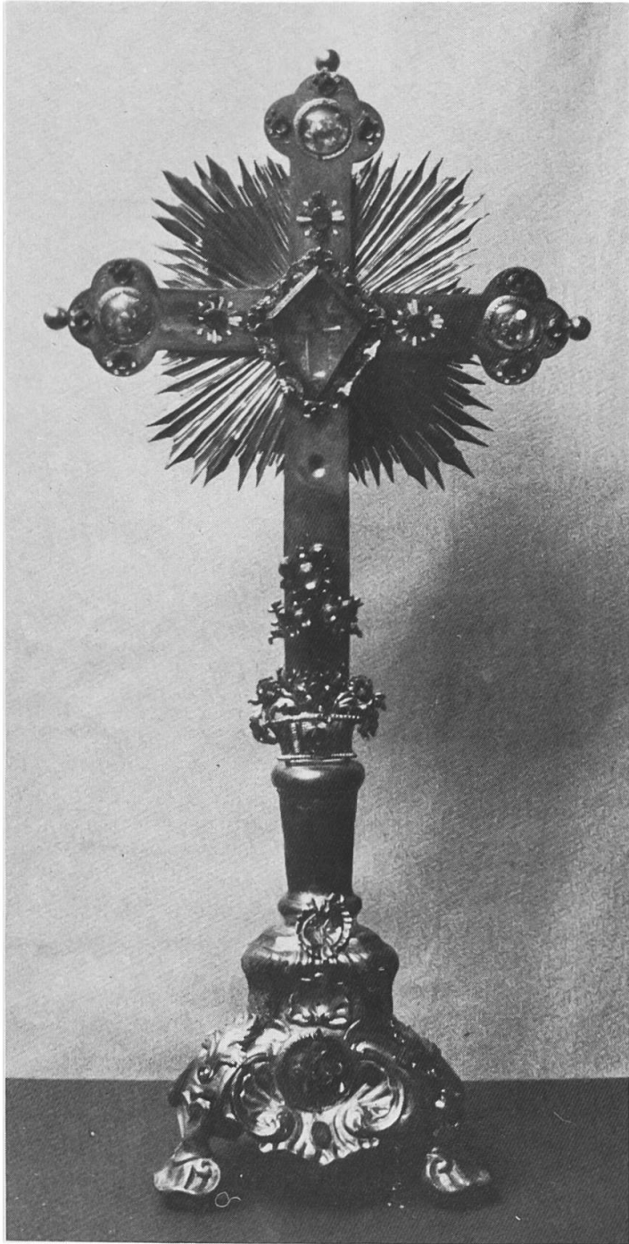
Strahlenkreuz , 73,7 cm hohes Kreuz mit Fuss, Silber mit bunten Steinen besetzt; Beschau Basel, Meisterzeichen HANDMAN, 1754

Lavaboplatte , 23 × 29 cm, oval polygon, Silber; Beschau Basel, Meisterzeichen HANDMAN, um 1750