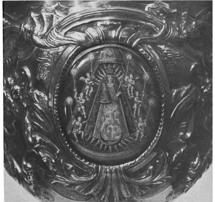
Mariastein, Gnadenbild; Emailmalerei auf dem Altermatt-Kelch, natürliche Grösse