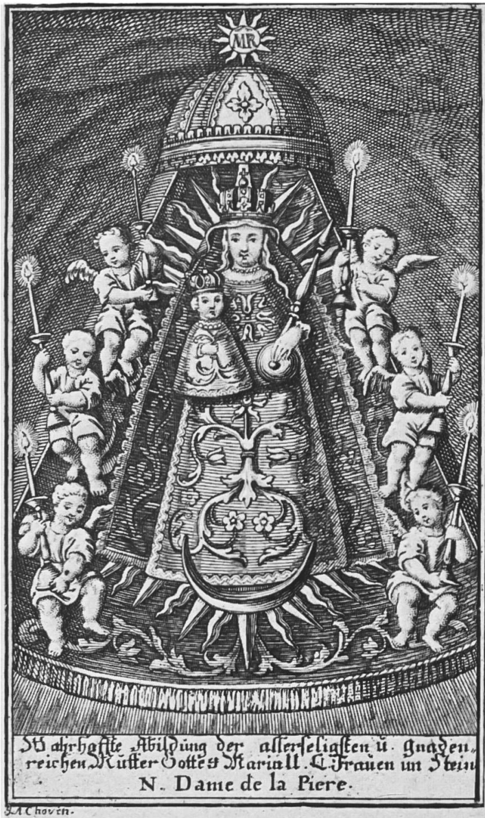
Mariastein, Gnadenbild; Kupferstich von Jacques Antony Chovin, Basel

zeichen den Stempel HANDMAN 2 und dürfte zur Abtweihe (1745) gestiftet worden sein.