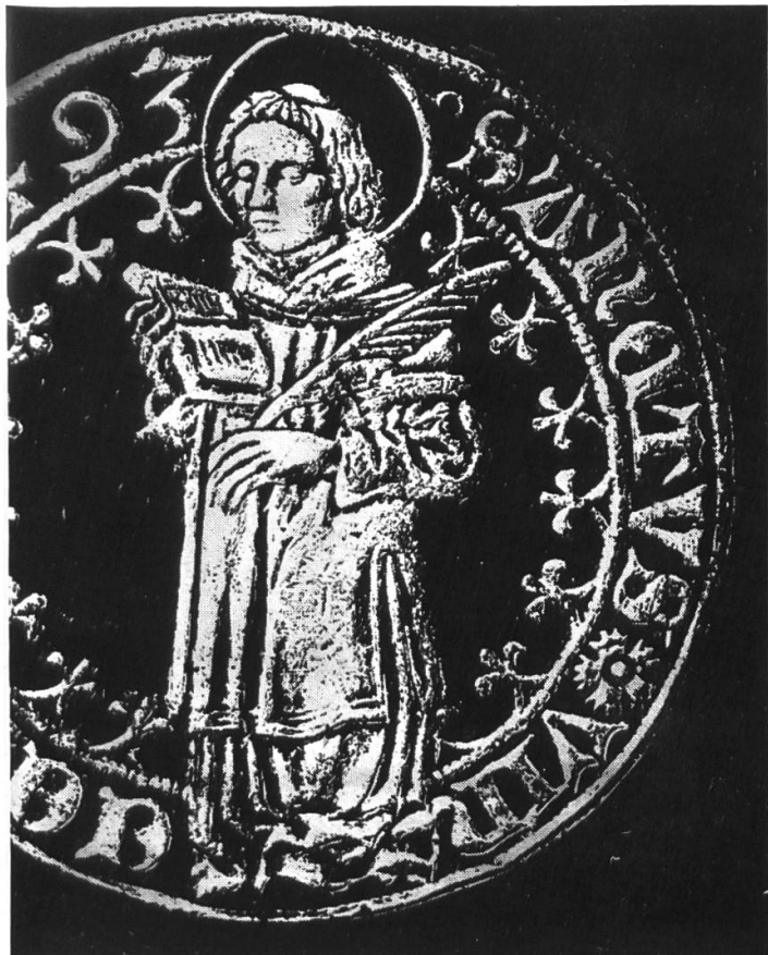
Vinzenz von Saragossa