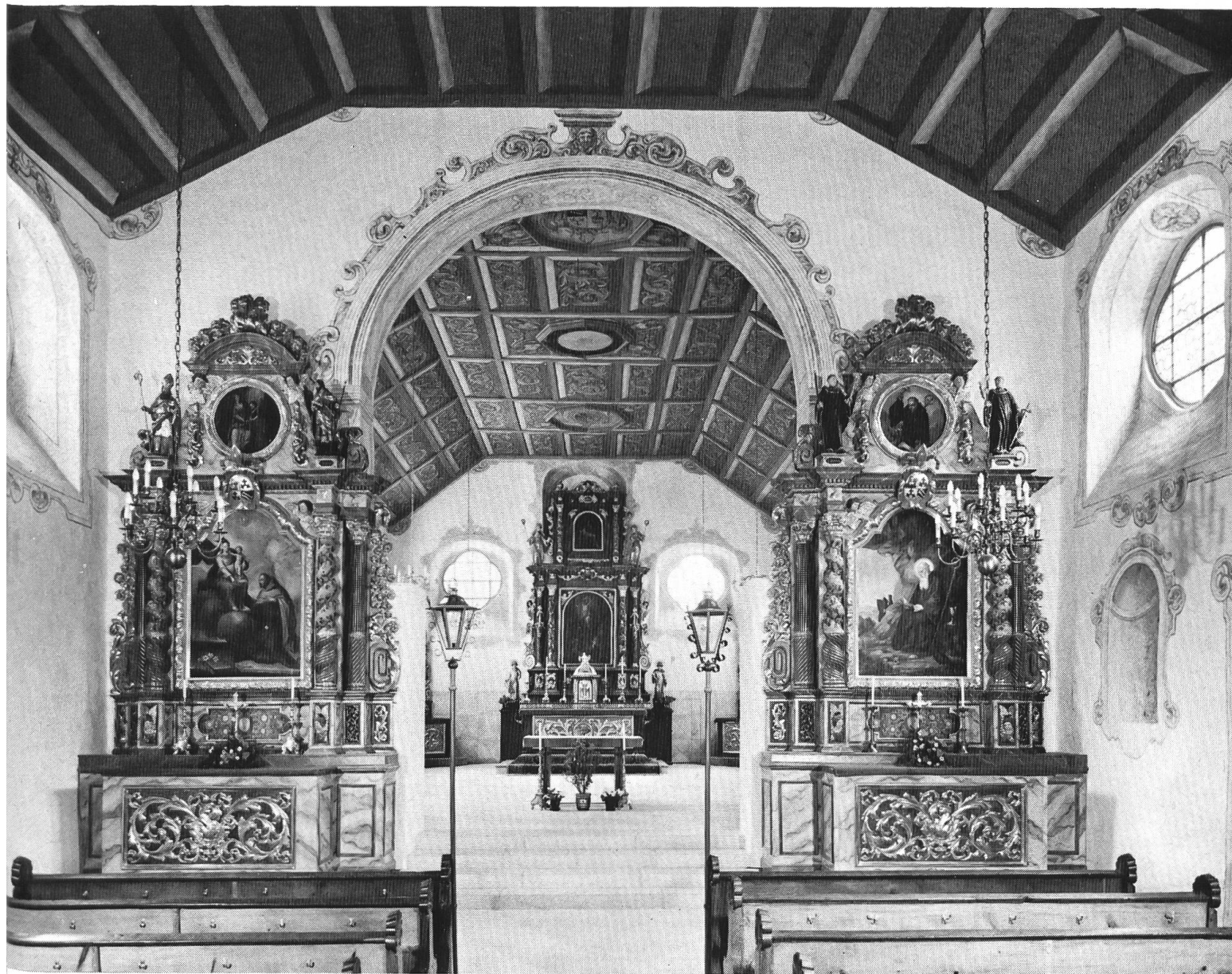
Die restaurierte Klosterkirche Beinwil vor dem Brand