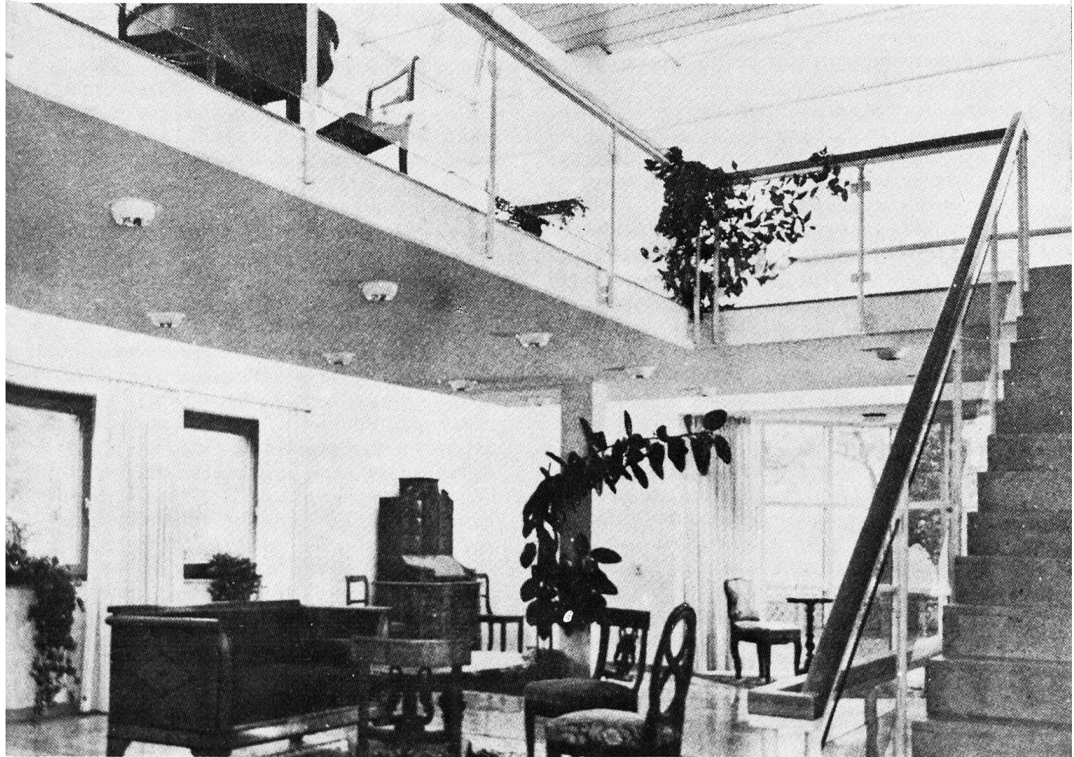
Halle im Neubau der Community Casteller Ring von 1980.