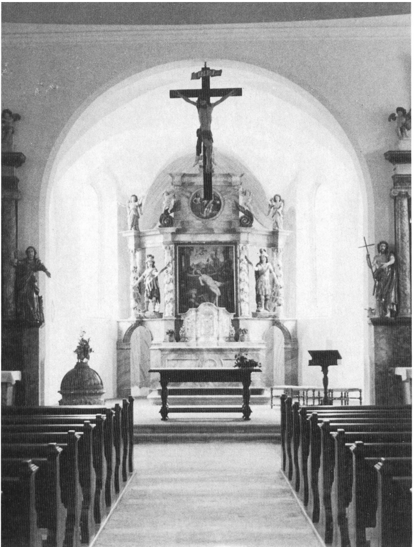
Pfarrkirche St. Laurentius, Rodersdorf: Im Licht barocker Schönheit zeigt sich der Hochaltar (Martyrium des hl. Laurentius, links und rechts die heiligen Urs und Viktor); im Hintergrund erkennbar der schwungvoll gemalte Vorhang.