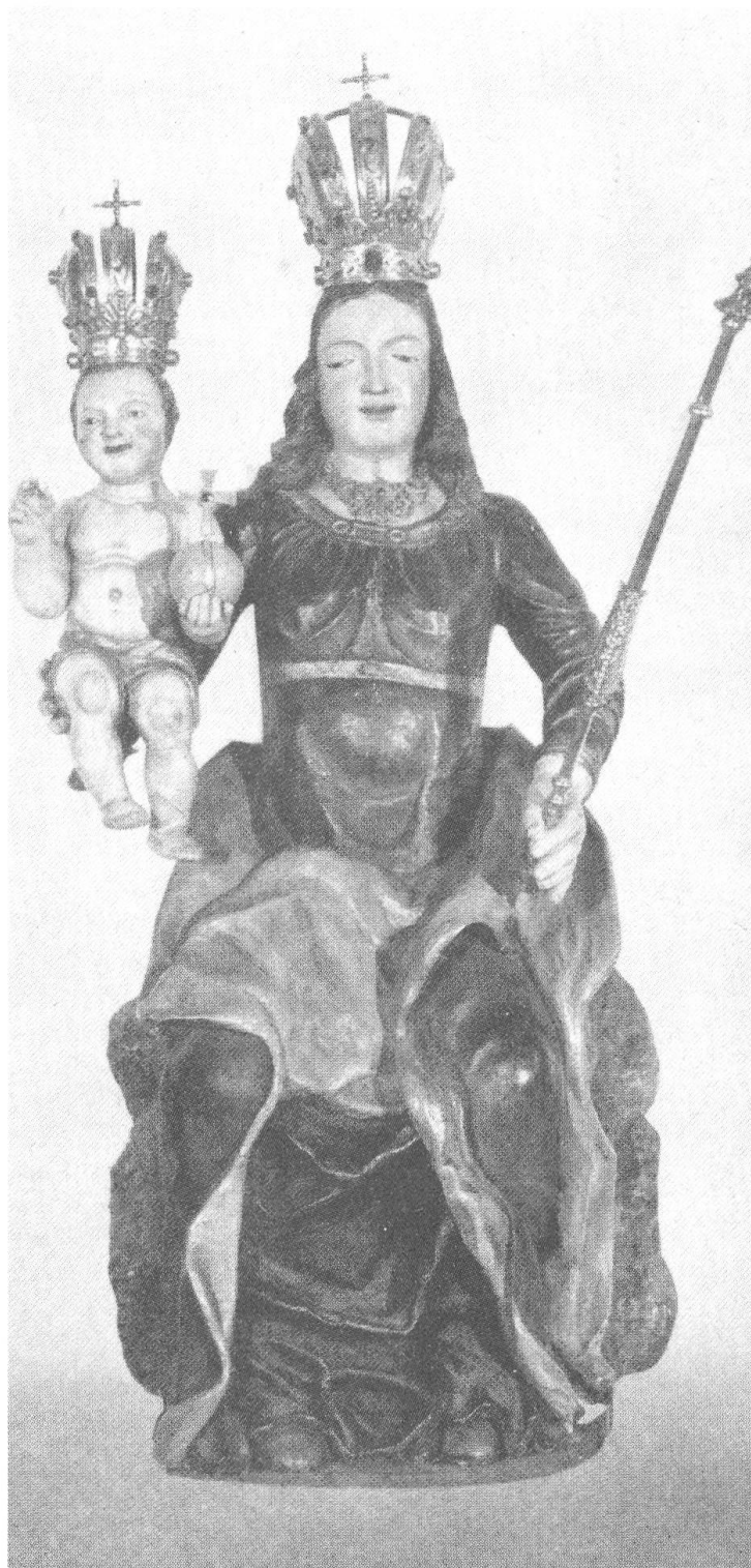
Mariastein, Gnadenbild, Mitte 17. Jb., Meister unbekannt.