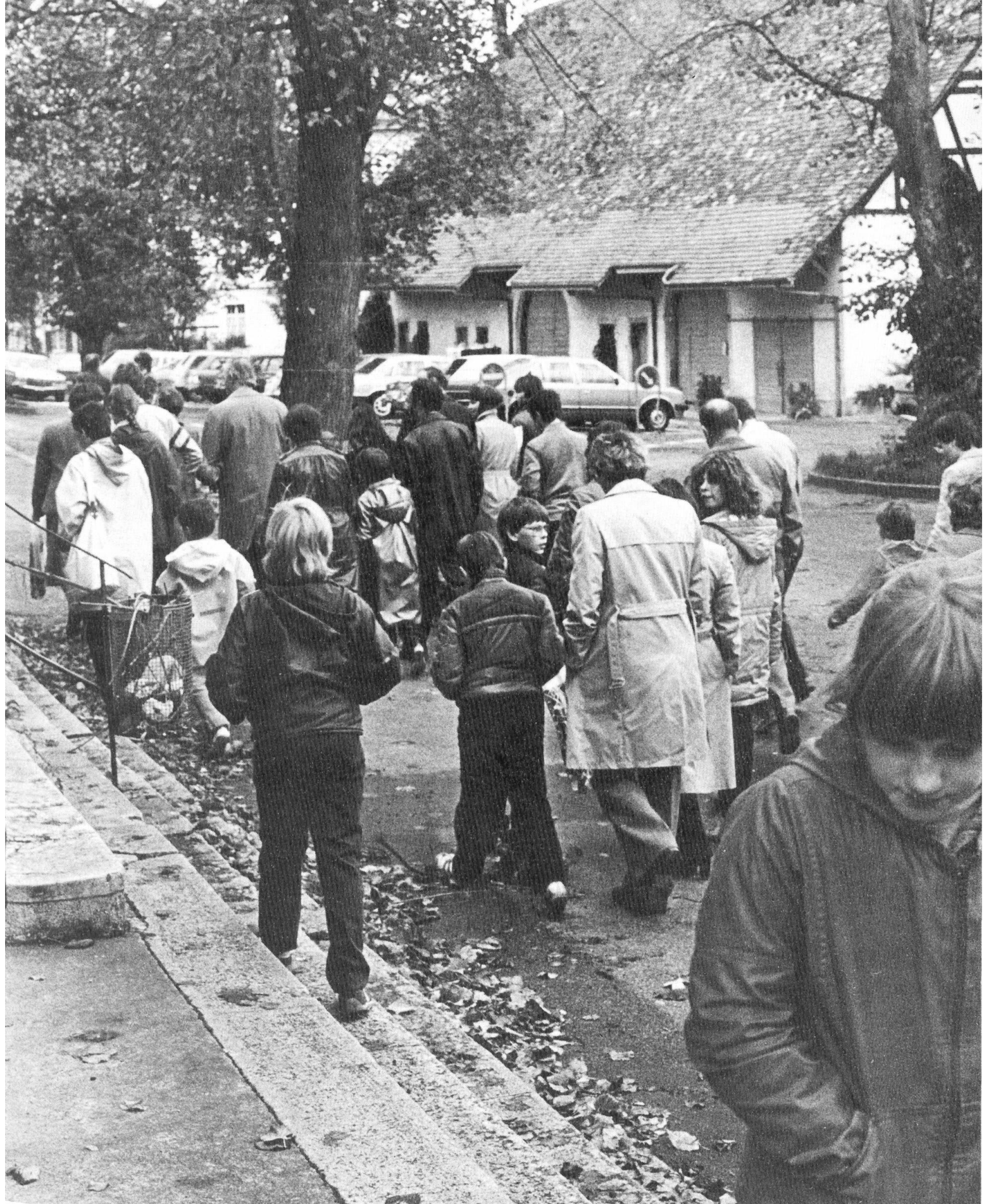
Auf dem Heimweg nach der Wallfahrt nach Mariastein.