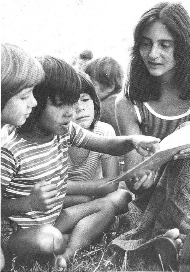
Strassenbibliothek (Aktion Wissen teilen).

ins Schweizerische Zentrum der Bewegung. Dort können Mann und Frau, Eltern und Kinder einander neu entdecken, ihre Fähigkeiten entfalten und so ihre Hoffnung für die Zukunft stärken. Sie nehmen damit teil am Kampf der Bewegung, dass alle Familien als Familien zusammenleben und auch gemeinsam in die Ferien gehen können.