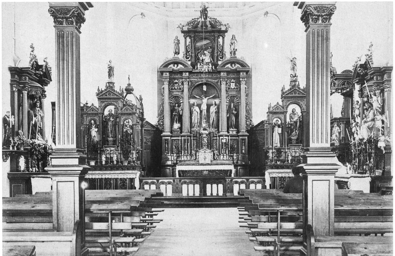
Inneres der Klosterkirche in Delle.