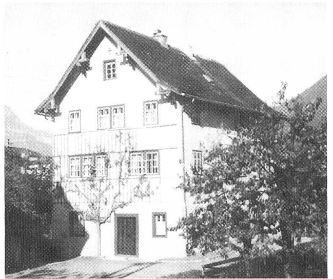
Das sog. Brickerhaus.

den (Abt an den Erziehungsrat, 13. September). Somit war die Weiterführung der land- und alpwirtschaftlichen Winterschule gesichert. Die Planung einer selbständigen Landwirtschaftsschule wurde getreu weiterverfolgt. Nach dem Studium verschiedener Projekte entschied sich der Landrat für einen Neubau (Schule und Internat) in Seedorf. Am 26. Mai 1957 gab das Volk mit knappem Mehr (2920 Ja gegen 2349 Nein) dazu seine Zustimmung. Der Neubau konnte im November 1958 bezogen werden, und die neue Schule nennt sich fortan Kantonale Bauernschule Uri in Seedorf. So endete die Landwirtschaftsschule am Kollegium, wozu das Kloster Mariastein neben den Lehrkräften das Brickerhaus als Internatsgebäude zur Verfügung gestellt hatte, nach genau zwanzig Jahren. Dazwischen lagen einige Spannungen und Querelen, aber für die meisten Landwirtschaftsschüler, die in diesen zwanzig Jahren die Schule und das Internat besucht hatten, waren es fruchtbare Jahre, für die sie sich dankbar zeigten.