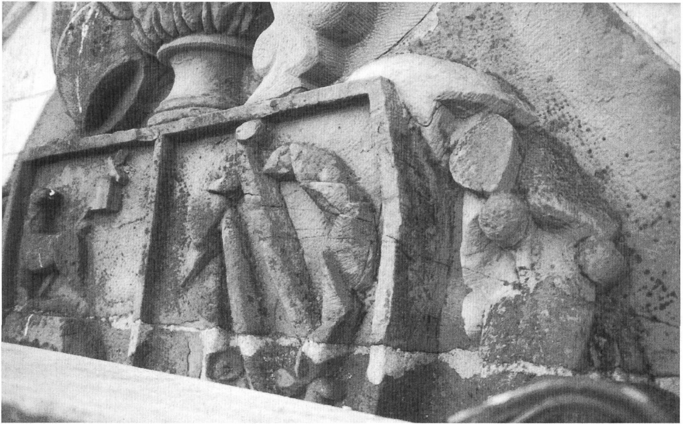
Wappen aus rotem Sandstein, verwittert und mit Flugalgen und Flechten belegt.

sadenproblem nach 23 Jahren wieder aktuell: Die Werkstücke sollten nun endlich eingefärbt werden. Doch nun stellte sich heraus, dass die Fassade inzwischen auch wieder wetterbedingte Schäden aufwies, die wohl oder übel bereinigt werden mussten, soll die Fassade vor grösseren Schäden bewahrt werden. Die Kalksteine und ihre Verfugungen waren zwar insgesamt intakt. Jedoch waren die Kunststoff-Verfugungen bei den kupfernen Blechabdeckungen verrottet. Sie mussten unbedingt erneuert werden, ebenso andere Abdeckungen, die gealtert waren. Auch hatten die Stürme einige Bleche verformt. Am meisten Probleme bereitete wieder der ungeschützte weiche rote Sandstein. Auf den Gesimsen lagen abgesprengte Stücke, Zeichen dafür, dass sich hier einiges in Bewegung setzte. Zudem waren sie erneut stark von Flugalgen und Flechten befallen. Die obere südliche «Flammenurne» hatte einen grossen Riss, so dass Gefahr bestand, dass in geraumer Zeit ein grösseres Stück herunterfallen könnte. Die Jalousien auf der Höhe der Glockenstube brauchten dringend einen neuen Farbanstrich. So ergab sich bei näherem Zusehen manches,