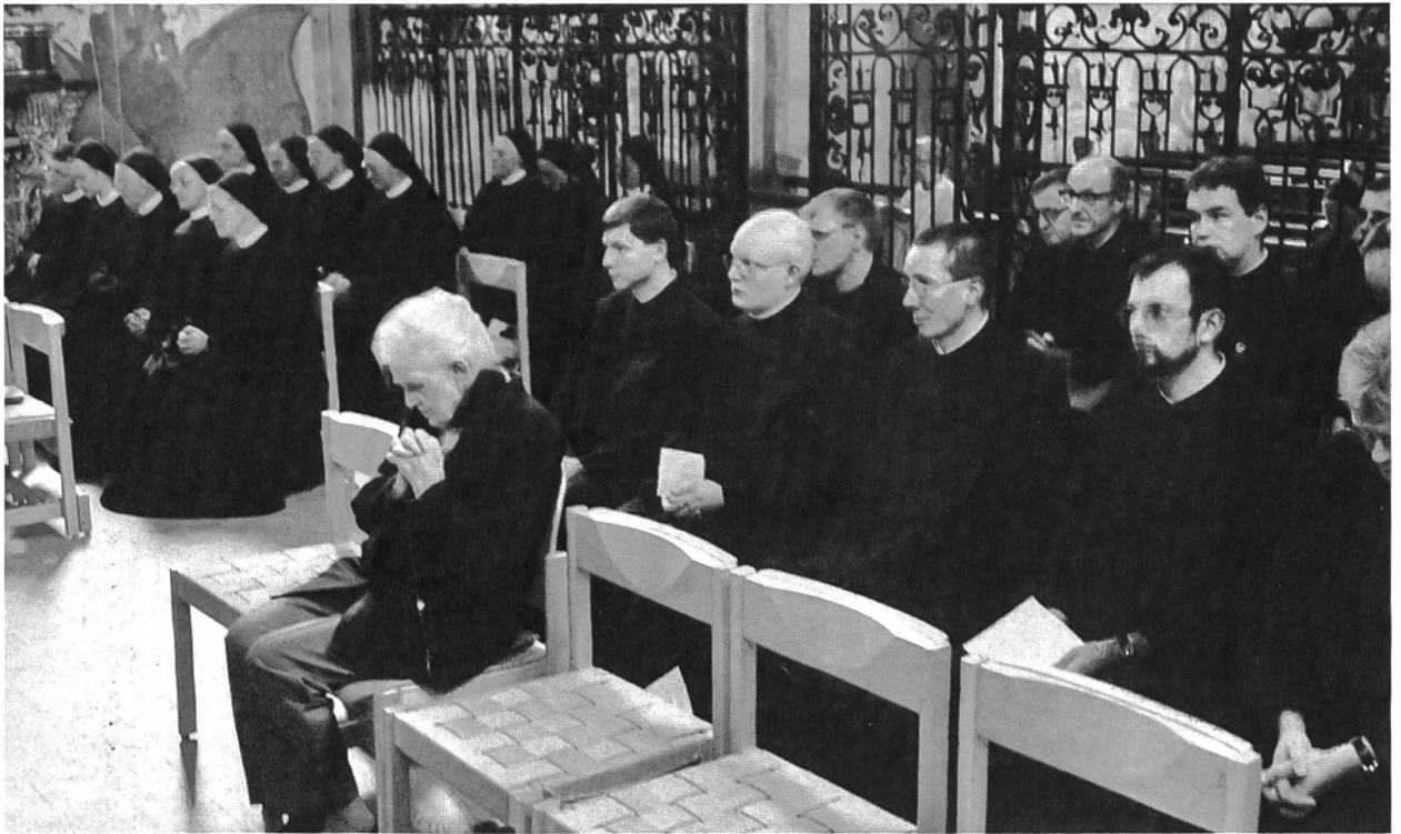
Wie einst Benedikt und Scholastika: Mönche von Mariastein und Nonnen vom Fahr beim gemeinsamen Gebet anlässlich ihrer Begegnung am 6. September 1999.

so weit unten erfährt und erkennt, der ist oben angekommen. In der Freiheit der vollendeten Gottesliebe, dort, wo er das Ganze, Gott und Welt, in einem einzigen Lichtstrahl schaut.