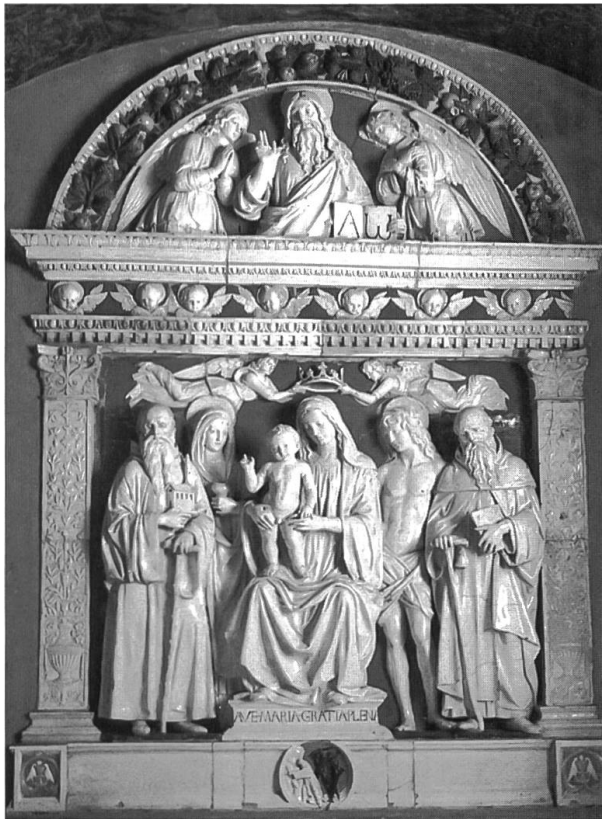
Altar im Eremo von Camaldoli. Es handelt sich um eine Terrakotta des Andrea della Robbia, ein Meisterwerk der Renaissancekunst aus dem 15. Jh.: Madonna mit Kind, links Romuald und Magdalena, rechts Johannes der Täufer und Antonius der Einsiedler.

Bei älteren Leuten wurden böse Erinnerungen wach. Zwei siebzigjährige Frauen, die über Ostern in Camaldoli zu Gast waren, begannen