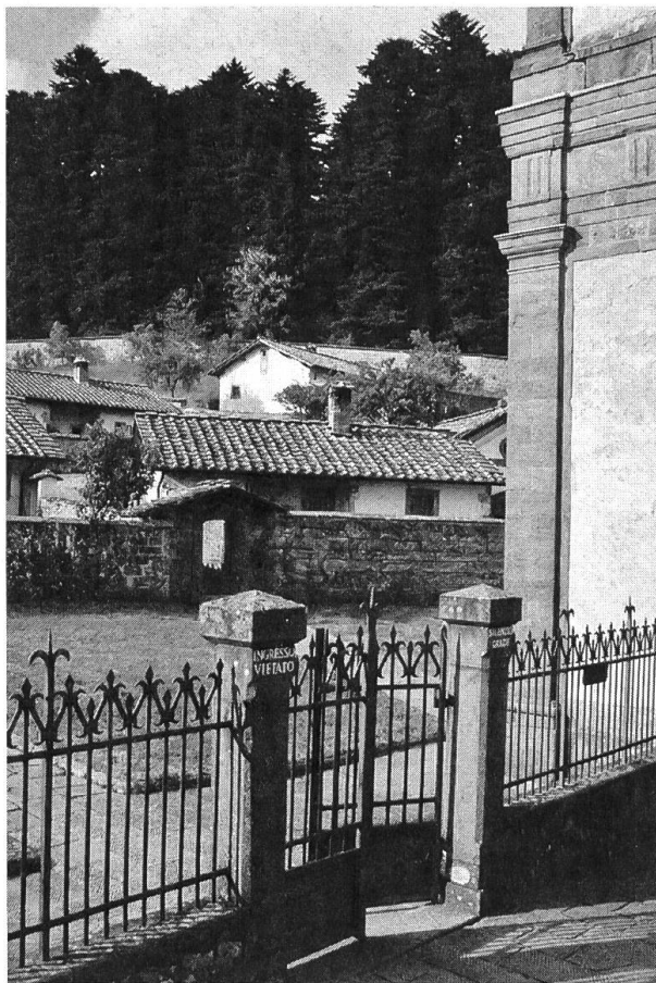
Blick in den Eremo von Camaldoli (im Hintergrund meine Cella).

frostige Kälte beim Aufstehen am Morgen war die deutlich spürbare Reaktion auf meine anfängliche Unbeholfenheit im Umgang mit dem Ding. Dank der freundschaftlichen Aufnahme im Kreis der zehn weissgewandeten Mönche, unter denen zwei weitere Dauergäste weilten, und auch durch den ruhigen Tagesrhythmus fand ich mich rasch zurecht. Viermal täglich trafen wir uns in der Kirche zum Gebet, und auch die Mahlzeiten führten uns zweimal am Tag zusammen. Neben verschiedenen kleinen Diensten, die ich für die Gemeinschaft zu erbringen hatte, blieb mir viel Zeit. Bald schon erkundete ich die nähere Umgebung und streifte regelmässig durch die weiten Wälder, die während Jahrhunderten von den Mönchen sorgfältig gepflegt wurden. Als im letzten Jahrhundert die Klöster aufgehoben wurden, wurden auch die Wälder von Camaldoli zur Staatsdomäne, was sie, mitsamt dem Kloster, bis heute geblieben sind. Seit ein