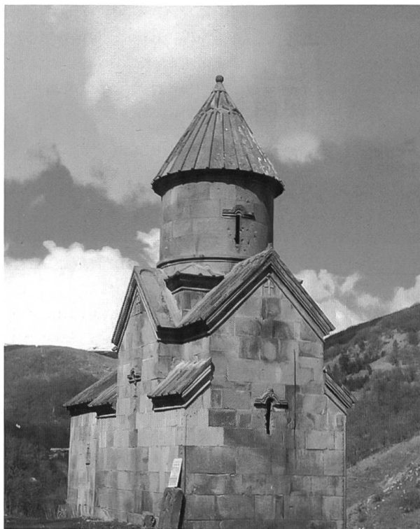
Typische armenische Kirche in Khetscharis

kennen konnten. Es waren letztlich sprachliche Schwierigkeiten dahinter, die man heute als solche erkannt hat, so dass sachlich heute kein dogmatischer Grund mehr besteht, getrennt zu bleiben, weder zur byzantinischen noch zur römischen Kirche. Doch hat die Geschichte inzwischen soviel Schutt aufgehäuft, dass es noch eine Zeitlang gehen wird, bis er weggeräumt ist. Es ging in jenem Konzil um die Dreifaltigkeit Gottes und die Gottmenschlichkeit Jesu Christi, die terminologisch möglichst genau festgelegt werden sollten. Die beiden entscheidenden Fachaus-