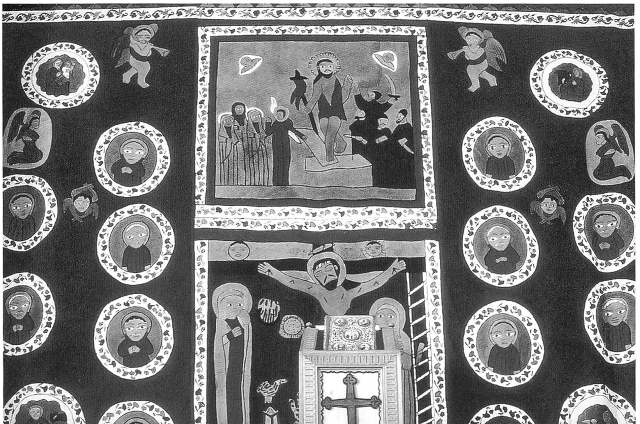
Klosterkirche St. Avgin (Arth SZ): Der Vorhang trennt den Altarraum, das Allerheiligste. Er erinnert an den Vorhang im Tempel von Jerusalem.

Dass man diese Kämpfe um Formeln und Begriffe heute mit anderen Augen betrachten muss, zeigt allein schon jenes Abkommen vom 23. Juni 1984 zwischen der Syrisch-orthodoxen und der Römisch-katholischen Kirche, das im pastoralen Notfall, wenn kein Priester der eigenen Konfession zur Hand ist, den