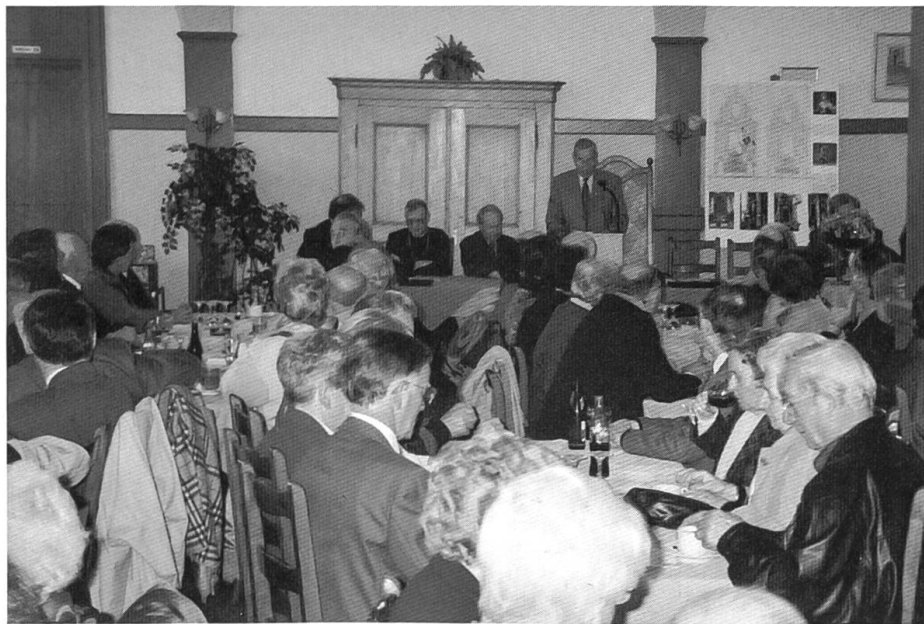
Blick in den Saal des Restaurant «Post» anlässlich der Generalversammlung vom 9. April.