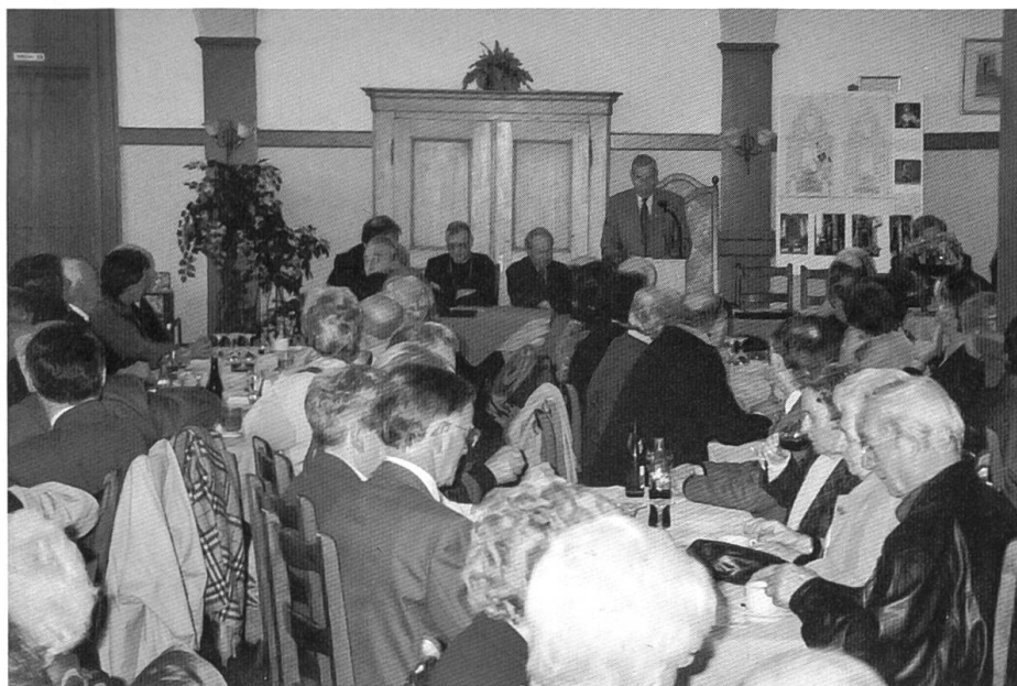
Blick in den Saal des Restaurant «Post» anlässlich der Generalversammlung vom 9. April.

Der Verein hat heute 2973 Mitglieder. In den beiden Berichtsjahren sind mehr Mitglieder eingetreten als ausgeschieden. Der sehr erfreuliche Zuwachs geht einerseits darauf zurück, dass der Verein im «Basler Pfarrblatt» von Pfarrblatt-Redaktor Josef Bieger vorgestellt