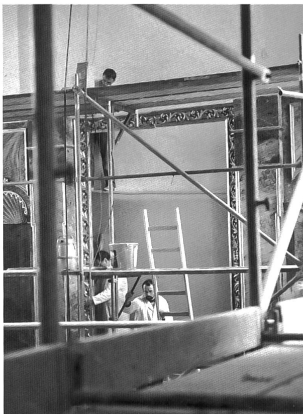
In den beiden ersten Maiwochen stellten Mitarbeiter der Fa. Stöckli (Stans) den renovierten Hochaltar auf. Hier wird eben der Rahmen der grossen Altarbilder montiert.

hunderts werden nur gereinigt, sie sind sonst noch gut erhalten. Eine neue, hochmoderne Beleuchtung und Lautsprecheranlage, die heisst nun Beschallungsanlage, werden installiert. In den bestehenden Fenstern werden elektrisch bedienbare Lüftungsflügel installiert, auch werden die Wappenscheiben der früheren Verglasung wieder Verwendung finden. Die Beichtstühle bekommen die ursprüngliche helle Färbung. Die Kirchenbänke werden wieder zweireihig aufgestellt, allerdings verkürzt, sodass die Seitenschiffe voll zur Geltung kommen werden. Dadurch werden aber einige Versteckplätze hinter den dicken Säulen eliminiert. Für den Tabernakel wird es eine neue Lösung auf dem rechten Seitenaltar geben. Die alte barocke Kanzel wird natürlich auch restauriert. Die grosse Orgel wird einer Totalrevision unterzogen und gereinigt. Die