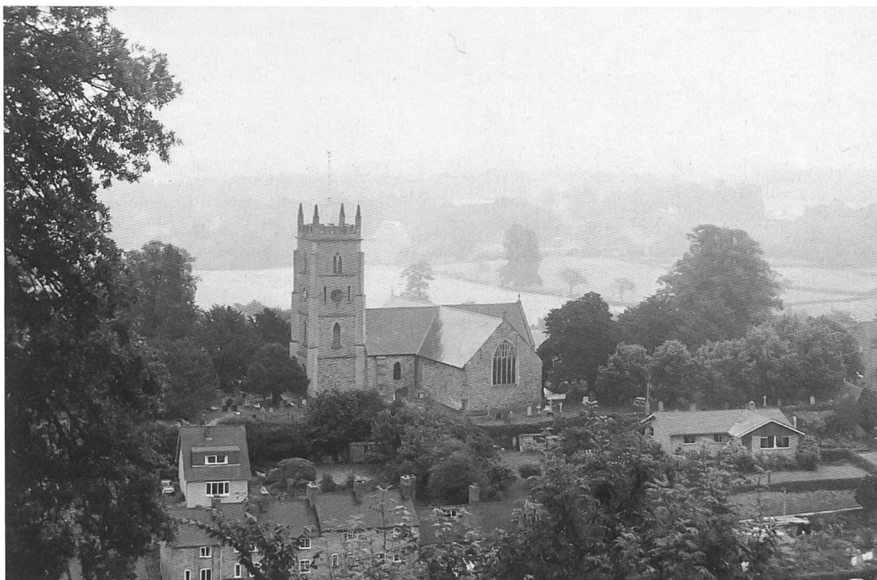
Im englischen Regen: die Dorfkirche von Montgomery, an der Grenze zwischen England und Wales gelegen.