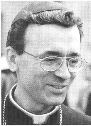
Bischof Joseph Werth