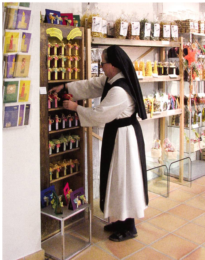
Boutique Bernhard (Kloster Wurmsbach): Neben Konfitüren von Sr. Ursula erhält man dort auch Grafisches, Fotografisches und Künstlerisches aus klostereigener Produktion.

«Prüft alles, und behaltet das Gute» (1 Thess 5,21). Diesen christlichen Grundsatz des heiligen Paulus haben wir auch bei der Neugestaltung zu beherzigen versucht. Vieles, so hat sich in zahlreichen anregenden Gesprächen in der Redaktion, in der Druckerei und mit Lesern herausgestellt, hat sich durchaus auch bewährt: so etwa das Format und das zweispaltige, leserfreundliche Layout. Zu den bewährten Elementen gehören neben der Agenda des Abtes und den gern gelesenen Buchbesprechungen inzwischen sicher auch die farbigen Fotos, eine Errungenschaft, die Pater Peter 2005 eingeführt hat. Die Reaktionen, die ich in den ersten anderthalb Jahren meiner Verantwortung für die Redaktion erhalten habe, bestätigen, wie wichtig eine reichhaltige Bebilderung ist. Bei den Fotos lohnt es sich auf keinen Fall zu sparen. Mag sein, dass die vielen Fotos nicht gerade einen intellektuellen Höhenflug unserer Zeitschrift