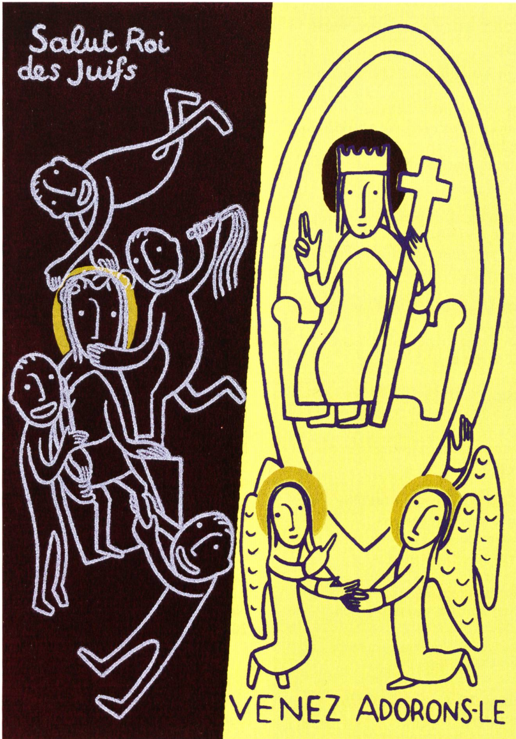
Passion und Herrlichkeit der Auferstehung. «Heil dir, König der Juden» und «Kommt, beten wir ihn an», von Frère Yves Vitry OSB, La Pierre-qui-Vire. Die Motive von S. 5 und S. 35 sind als Postkarten-Set zusammen mit anderen Motiven des Kirchenjahres (vgl. Mariastein 6/2010) im Benediktinerkloster Abbaye de la Pierre-qui-Vire (F-89630 Saint-Leger-Vauban) erhältlich.