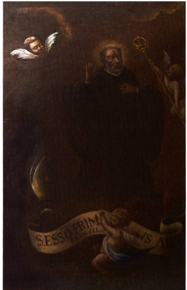
Der selige Esso, Mönch von Hirsau und erster Abt des Klosters Beinwil (Ölgemälde, Mariastein).

Schon 830–838 erstand in Hirsau das erste Kloster auf dem rechten Nagoldufer. Dort lag auch das erste Ziel unserer Fahrt, die romanische Aureliuskirche, die noch unter Abt Wil-