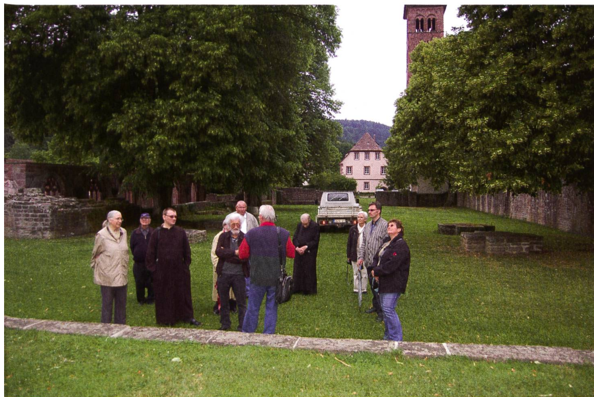
In der Vierung der ehem. St. Peter und Pauls-Klosterkirche von Hirsau. Ausser dem sog. «Eulenturm» (im Hintergrund) stehen nur noch einige wenige Grundmauern des einst riesigen Kirchenbaus.

Dann ging es heimzu nach Freiburg und Basel – voller Dank gegen Gott, der uns behütet hatte, dass kein «Unheil uns schadete». Der Regen hat uns zwar den ganzen Tag begleitet, aber immer dann ausgesetzt, wenn wir nicht im Auto oder in den Gebäuden waren. So ging dieser schöne, erlebnisreiche Tag, der unsere Gemeinschaft der Oblaten noch bestärkte, zu Ende. Er hat uns viel Freude gebracht.