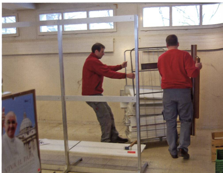
Februar 2015: Umbauarbeiten im Klosterladen «Pilgerlaube».

«Jahr der Orden» soll dafür den Rahmen abgeben. Der Blick auf Maria kann uns Mönchen und Ordensleuten wertvolle Impulse vermitteln, davon möchten wir gern unseren Pilgern etwas mitgeben. Hier berühren sich Diesseits und Jenseits, wie es auch bei den geistlichen Einsätzen der Fall ist, für welche die Mitbrüder unterwegs sind.