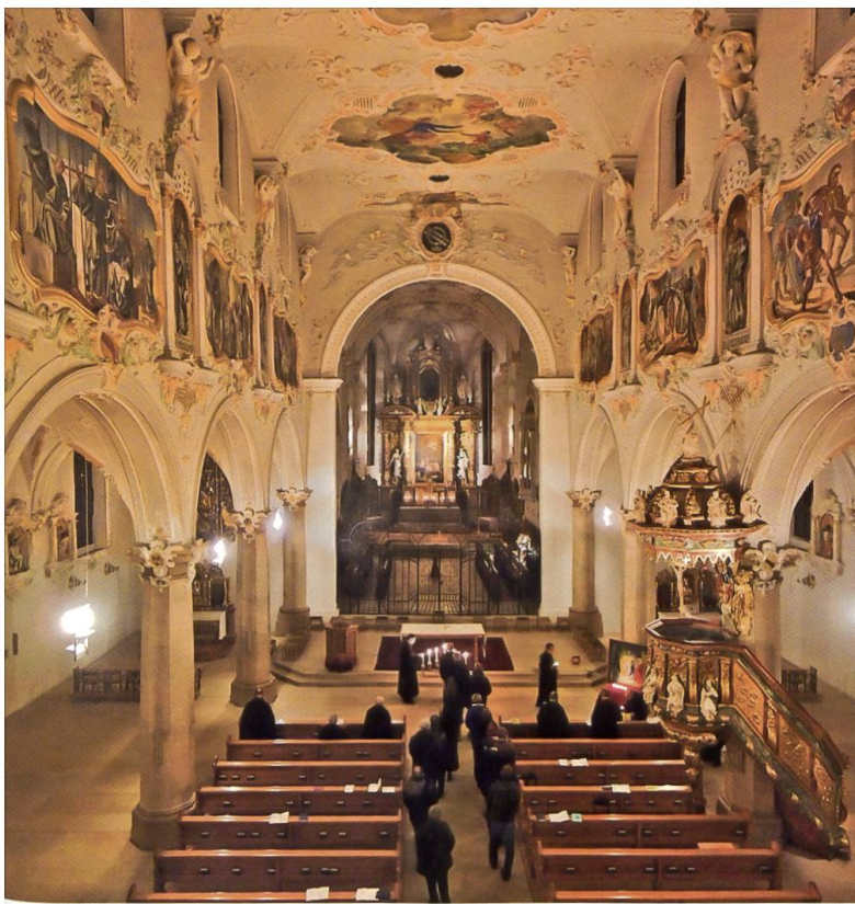
Der Messias zeigt sich seinem Volk erstmals im Tempel (Lk 2,21-40): Vigil am 1. Februar 2015, am Vorabend des Festes Darstellung des Herrn («Mariä Lichtmess»).