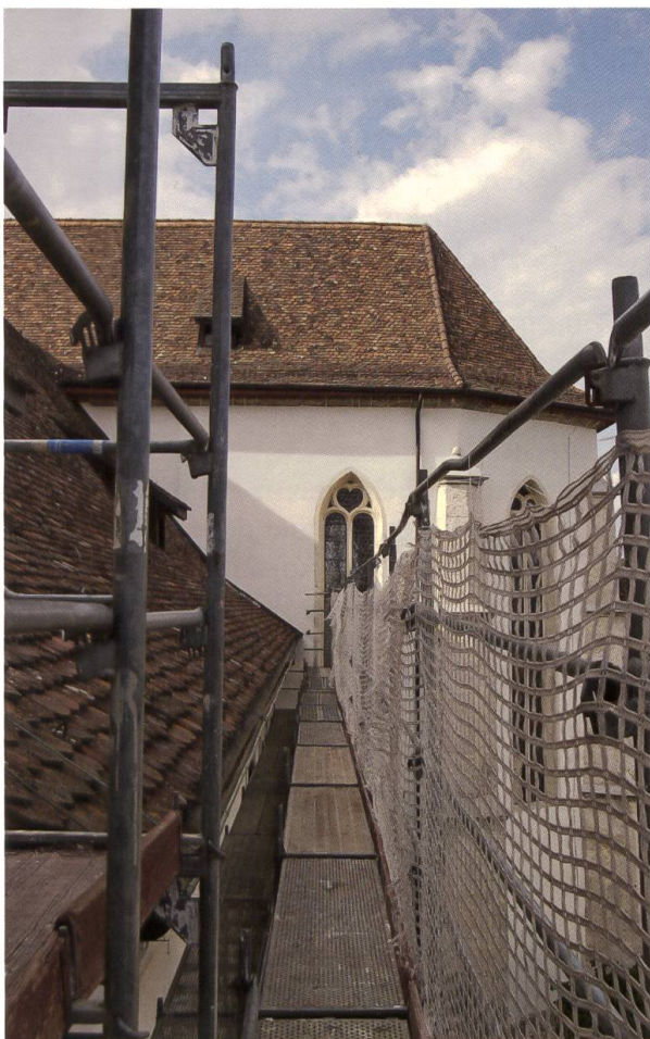
Gerüst an der Ostfassade des Konventbaus (Juni 2014). Die Kosten für die Renovation wurde vom Verein «Freunde des Klosters Mariastein» übernommen.