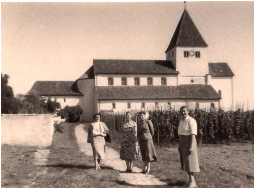
Oblatenausflug 1954 auf die Klosterinsel Reichenau (hier: Oberzell).