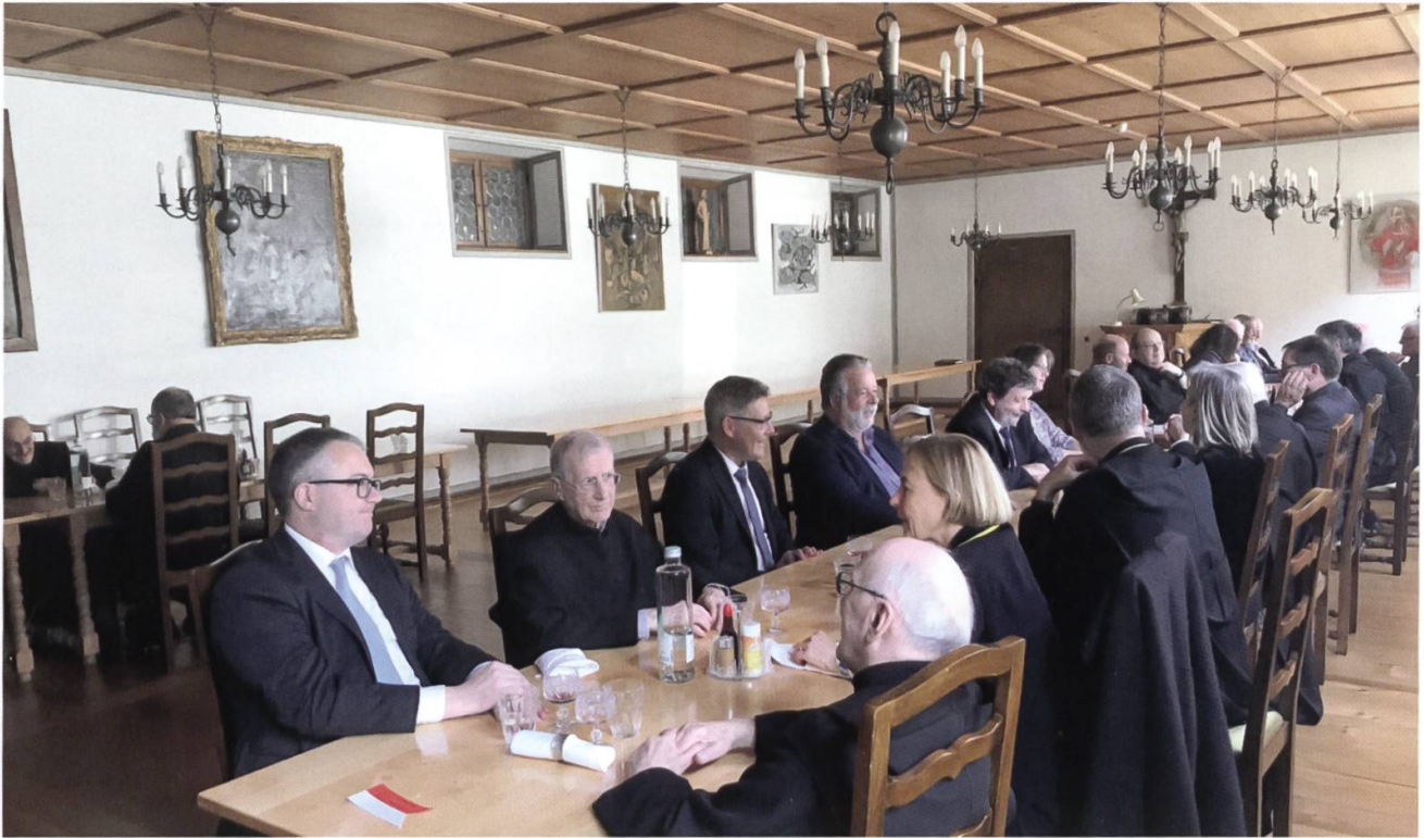
Am 2. April 2019 tagte der Regierungsrat des Kantons Solothurn zu seiner Sitzung im Kloster Mariastein anstatt in der Kantonshauptstadt. Anschliessend assen die Regierungsglieder samt Staatsschreiber, Chauffeuren und der Öffentlichkeitsbeauftragten mit den Mönchen im Refektorium (oben) und zeigten sich auch beim anschliessenden Kaffee (unten) gesprächsbereit.