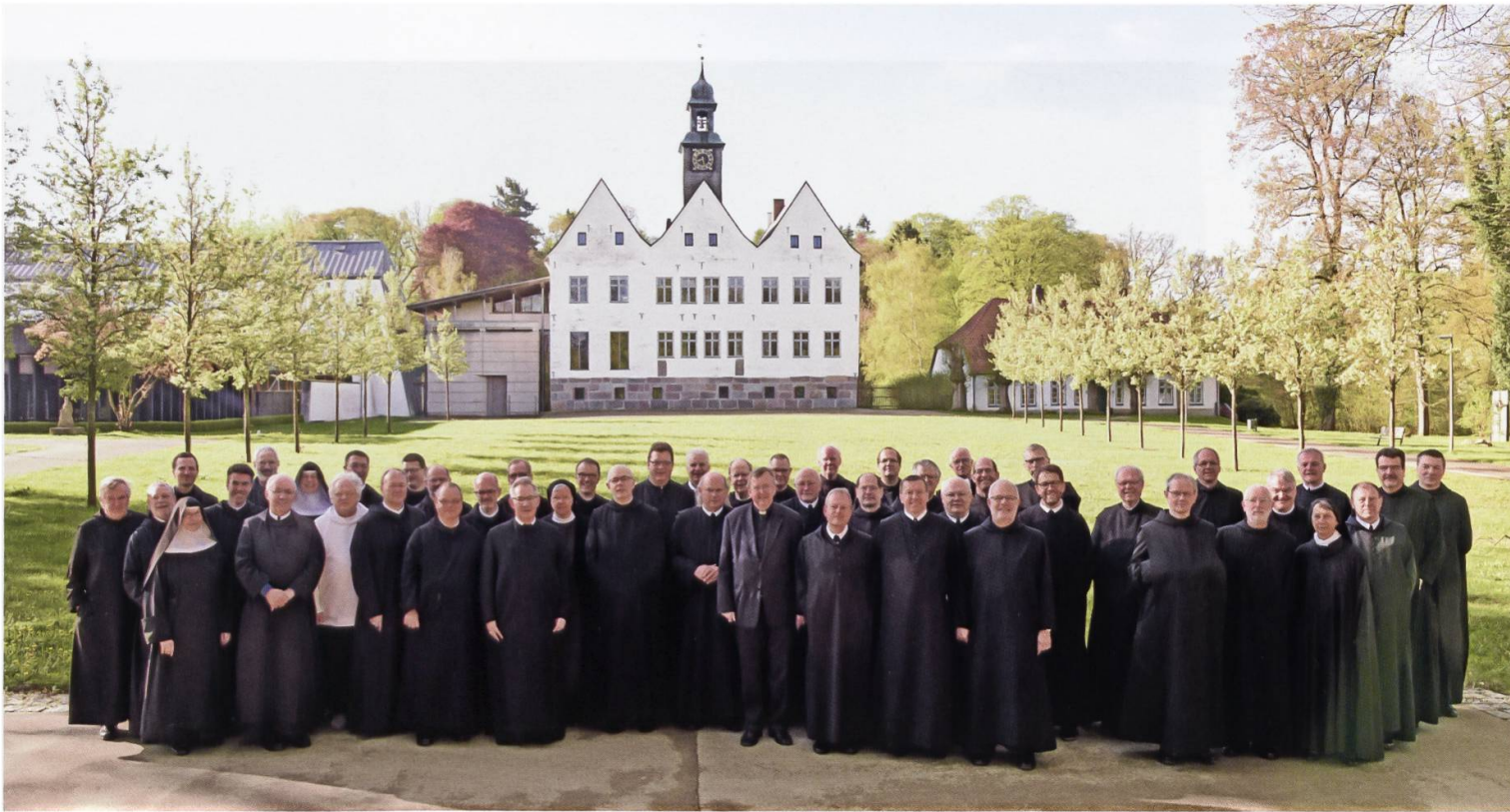
Äbte unterwegs: Zur jährlichen Tagung der sog. «Salzburger Äbtekonferenz» in der Osterwoche trafen sich die Äbte der deutschsprachigen Benediktinerklöster dieses Jahr im Kloster Nütschau im hohen Norden Deutschlands. Neben den Sitzungen blieb auch Zeit für einen Ausflug in die Hansestadt Lübeck.