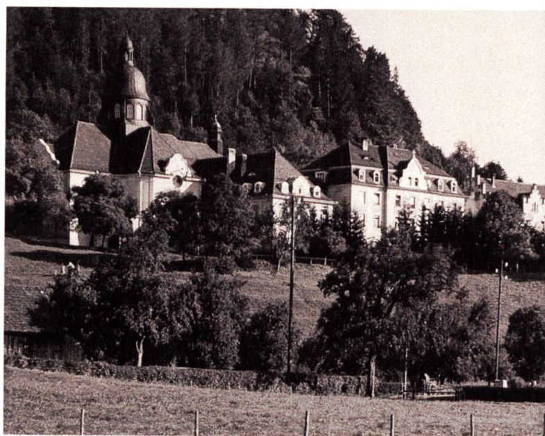
Das ehemalige St. Gallus-Stift in Bregenz.