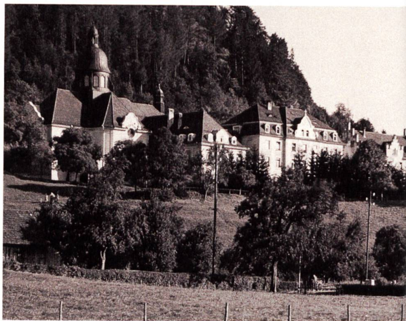
Das ehemalige St. Gallus-Stift in Bregenz.