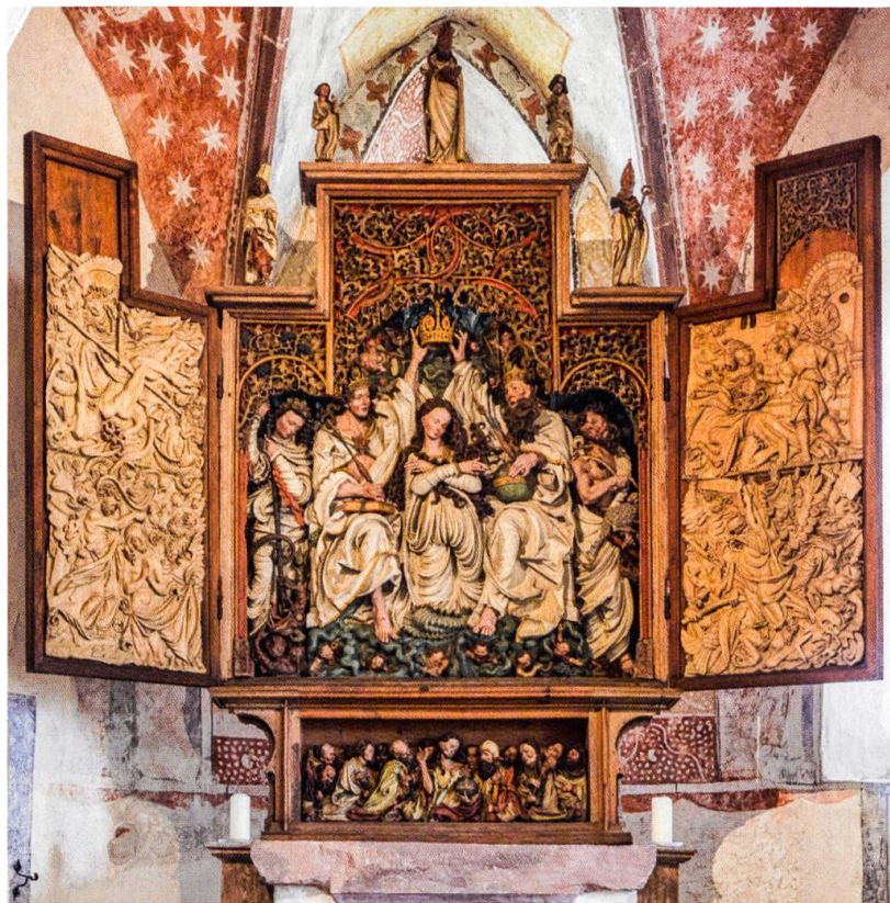
Der Marienaltar aus dem 12. Jh. mit qualitativollen Schnitzereien.