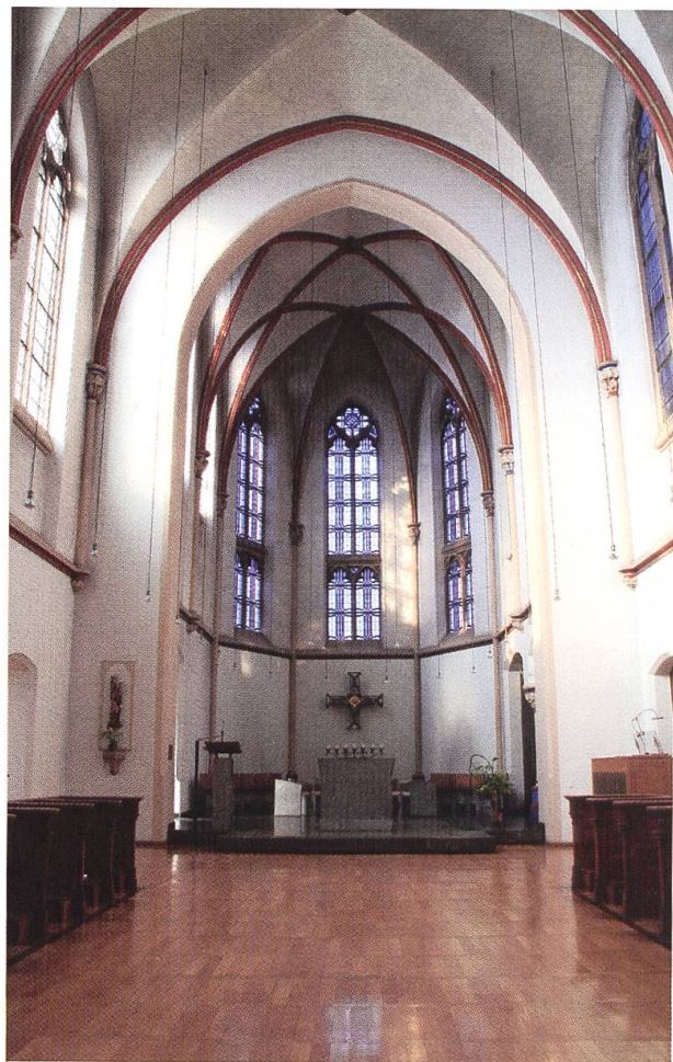
Klosterkirche, Altarraum und Nonnenchor.

Geistlich geprägt ist die Gemeinschaft von der Auseinandersetzung mit den Kirchenvätern. Die Schriften dieser frühen Theologen der Kirche für das eigene Leben, aber auch für Wissenschaft und Liturgie fruchtbar zu machen, ist ein grosses Anliegen. Ein dem Kloster zugehöriger Gastbereich bietet Menschen die Möglichkeit, eine Zeit lang am klösterlichen Leben teilzunehmen, zur Ruhe zu kommen, ihren Glauben zu vertiefen. Die Paramentenwerkstatt, in der kirchliche Textilien noch in Handarbeit gefertigt werden, eine kleine Kerzengiesserei und die Mitarbeit an verschiedenen theologischen Projekten vervollständigen ihre Arbeitsfelder.