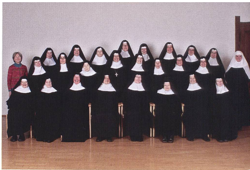
Konvent mit 24 Schwestern.