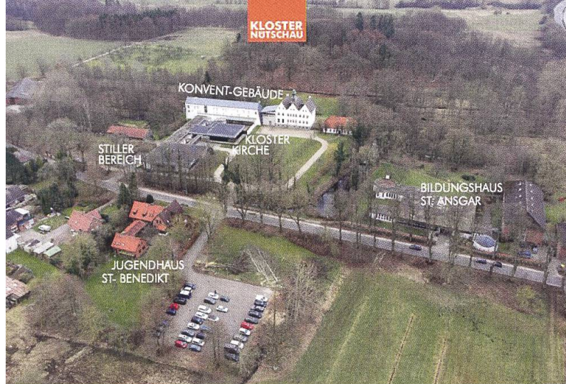
Überblick über das gesamte Klostergelände.