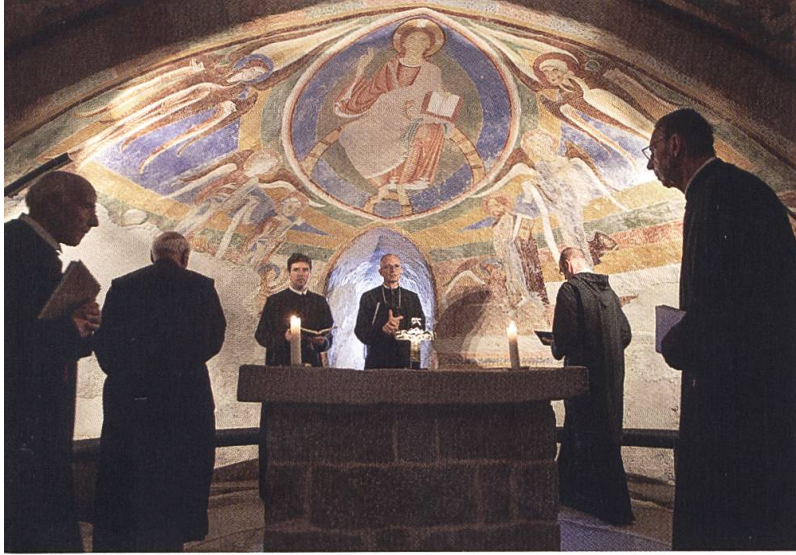
Gottesdienst in der Krypta (1160 geweiht).