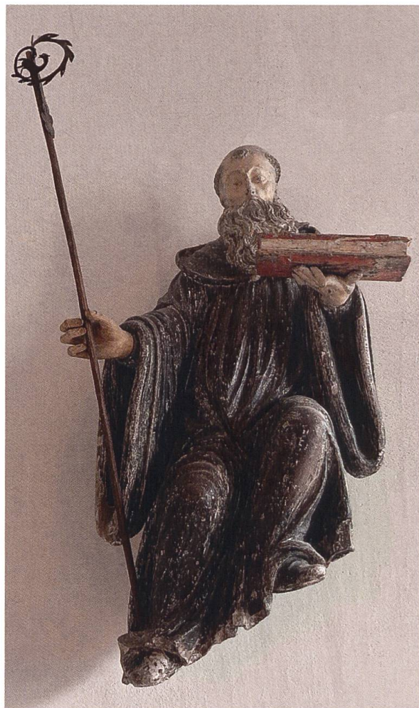
Barocke Skulptur des heiligen Benedikt in der Mariasteiner Benediktskapelle.

Laut Orden.online gibt es heute weltweit etwa 8000 Benediktinermönche, die 341 selbstständigen Mönchsklöstern angehören und etwa 16 000 Nonnen und Schwestern aus 840 Klöstern. Wer durch die vielseitige benediktinische Landschaft surfen möchte, findet auf der Homepage «Benediktiner weltweit», www.osbatlas.com die nötigen Informationen.