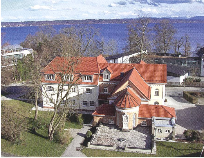
Gästehaus mit Ausblick.