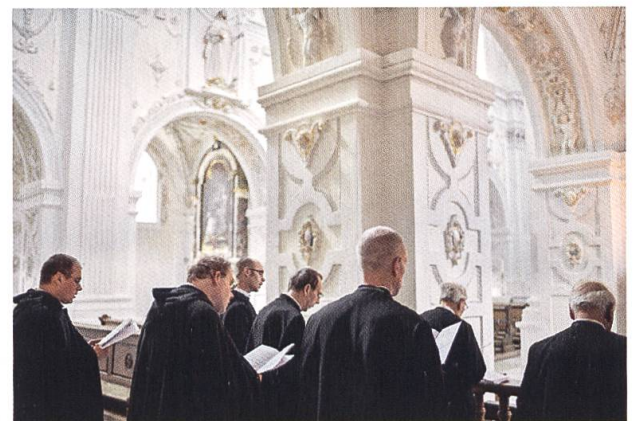
Chorgebet in der Klosterkirche.