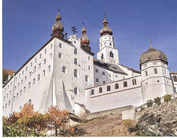
Typische Ansicht der Klosteranlage.