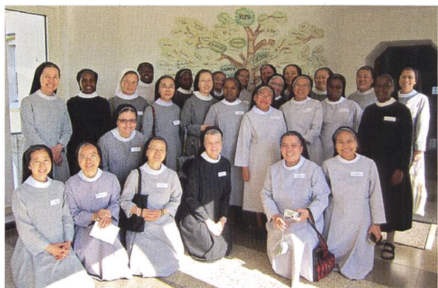
Schwwestern aus der ganzen Welt zu Gast.