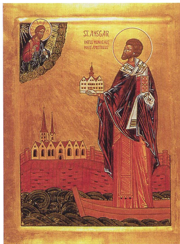
Der heilige Ansgar, aus der Hand von Br. Ansgar Stukenborg OSB, Mönch im Kloster Nütschau.

Als geistliches Zentrum im Erzbistum Hamburg ist dieser Ort für das christliche Leben in Norddeutschland prägend. So bleibt der apostolische Gründungsauftrag nach dem 2. Weltkrieg, eine geistliche Heimat zu bieten, lebendig und hat an Aktualität nicht verloren, denn wer hier lebt oder zu Gast ist, soll spüren, dass Gott den Menschen Hoffnung und Zukunft gibt.