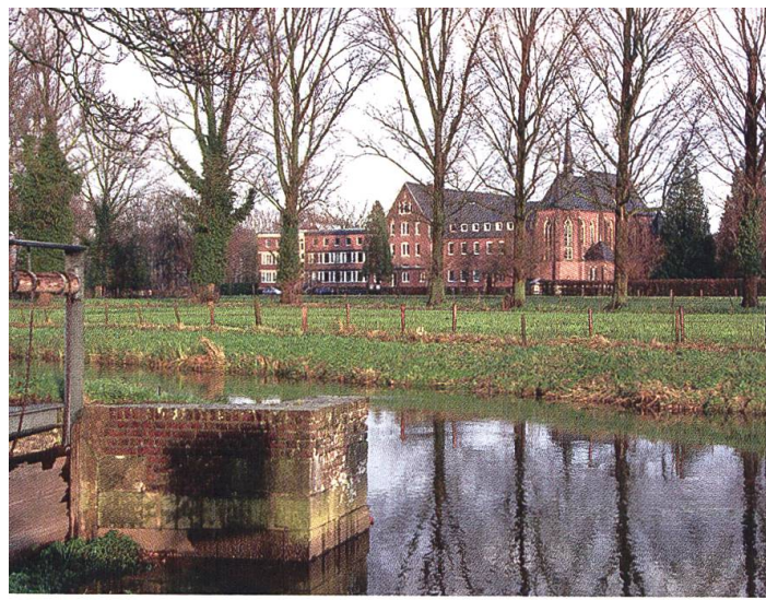
Kloster und Gästehaus.